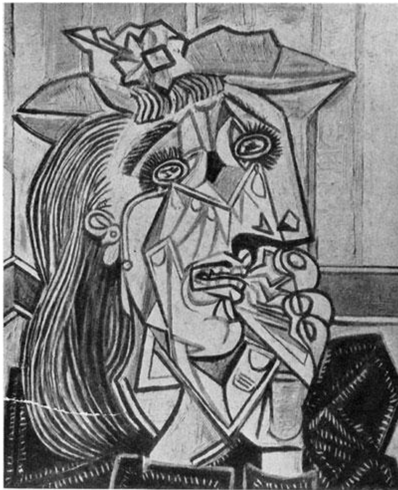
П. Пикассо. Плачущая женщина. 1937 г. Лондон, собрание Перро