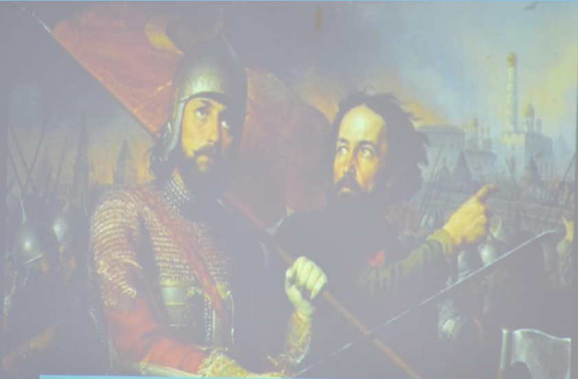
Минин и Пожарский – защитники земли русской