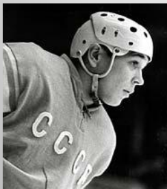
Александр Мальцев – один из лучших хоккеистов в мировом хоккее.