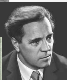
АСТАФЬЕВ Виктор Петрович