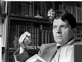
АБРАМОВ Федор Александрович