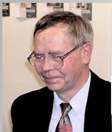
РАСПУТИН Валентин Григорьевич