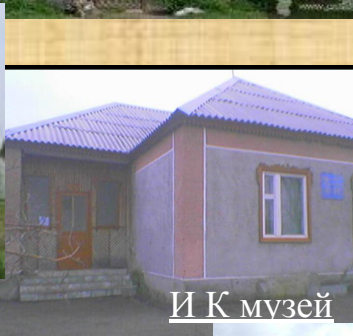
И К музей