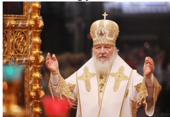
Патриарх Кирилл – глава Русской православной церкви