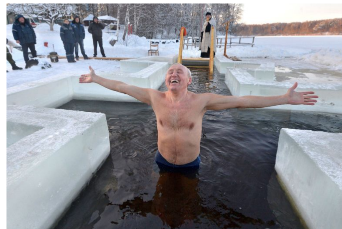
Купание на Крещение