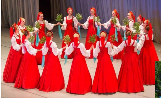
Хороводный танец «Берёзка»

Обряды, приуроченные к крупным праздникам, включали большое количество разных произведений народного искусства (фольклор): старинные лирические, свадебные, хороводные, песни. В повседневной жизни преобладали приговорки (смешные, остроумные поговорки или пословицы, небольшие рассказы или стихотворения), игры («Горелки», «Петушины бои» и т.д.), танцы (хороводы, плясовые: «Барыня», «Берёзка», «Калинка» и другие), драматические сценки, пестушки (короткие стихотворные напевы нянюшек и матерей), загадки, сказки, частушки и многое другое