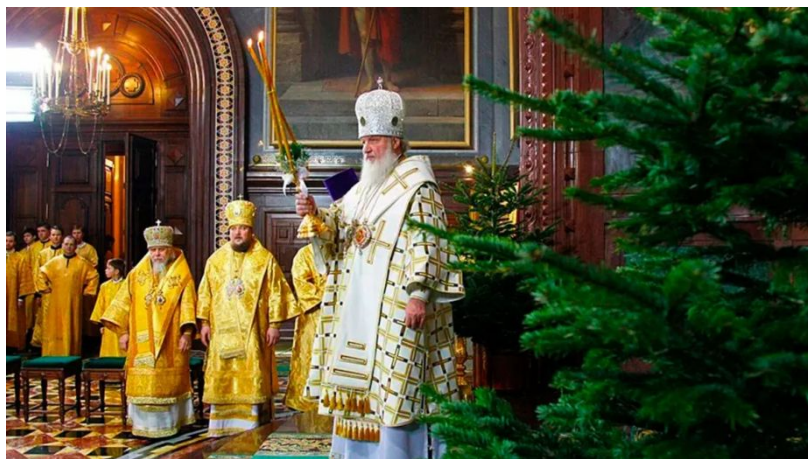
Богослужение на Рождество

Купание в проруби в ночь на Крещение Господне также стало всенародной традицией