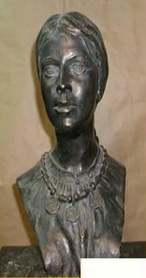
Девушка племени вятичи