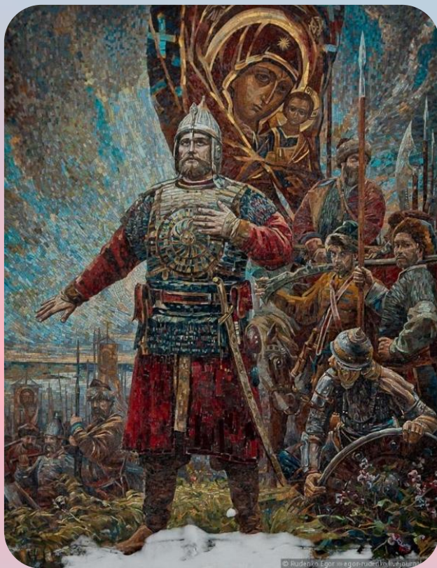
Князь Дмитрий Пожарский

По предложению Минина на пост главного воеводы был приглашен 30-летний новгородский князь Дмитрий Пожарский . Под знамена Пожарского и Минина собралось огромное по тому времени войско - более 10 тысяч служилых поместных людей, до трех тысяч казаков, более тысячи стрельцов и множество "даточных людей" из крестьян.