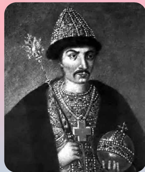
Воевода Прокопий Ляпунов

Первое народное (земское) ополчение возглавил рязанский воевода Прокопий Ляпунов. Но из-за распрей между дворянами и казаками, которые по ложному обвинению убили воеводу, ополчение распалось 19 марта 1611 года.