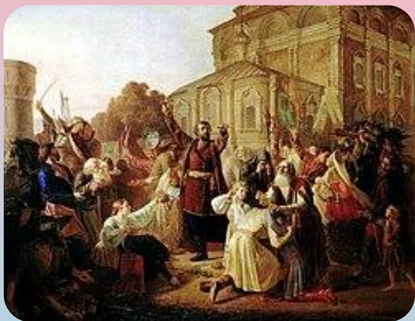
Призыв Кузьмы Минина к созданию ополчения

Он говорил о поруганных святынях, об угрозе порабощения. Призывал действовать сообща, всем миром. Не заискивал перед аудиторией.