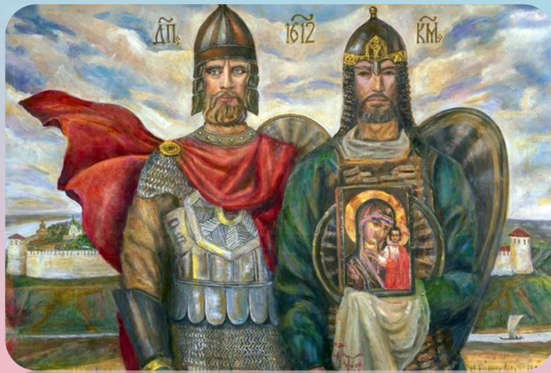
Князь Пожарский и Кузьма Минин с иконой Казанской Божией Матери

Уверенность, что благодаря именно иконе Казанской Божией Матери была одержана победа, была столь глубока, что князь Пожарский на собственные деньги специально выстроил на краю Красной площади Казанский собор. С тех пор Казанскую икону начали почитать не только как покровительницу дома Романовых, но и было установлено обязательное празднование 4 ноября как дня благодарности Пресвятой Богородице за ее помощь в освобождении России от поляков (отмечался до 1917 года).