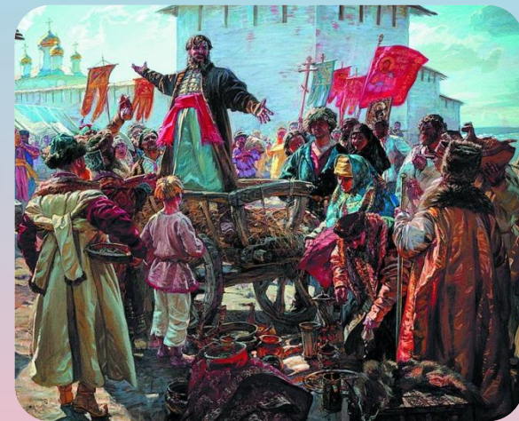
Знаменитая речь Кузьмы Минина на городской сходке

По призыву Минина горожане добровольно давали на создание земского ополчения "третью деньгу".