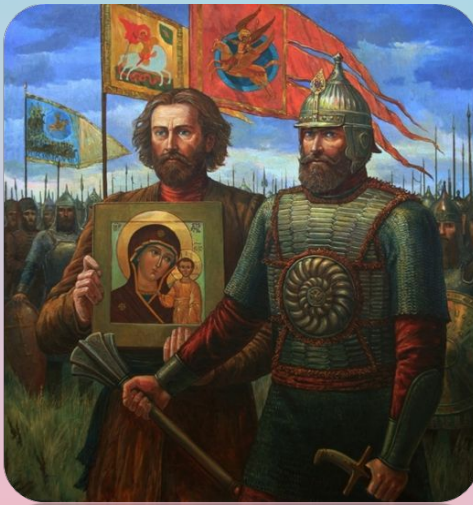
Кузьма Минин и Дмитрий Пожарский

С чудотворной иконой Казанской Божией Матери, явленной в 1579 году, Нижегородское земское ополчение сумело 4 ноября 1612 года взять штурмом Китай-город и изгнать поляков из Москвы.