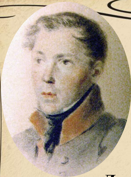
Федор Федорович Матюшкин. Портрет неизвестного художника.