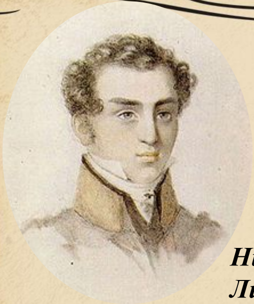
Корсаков Николай Александрович. Портрет неизвестного художника.