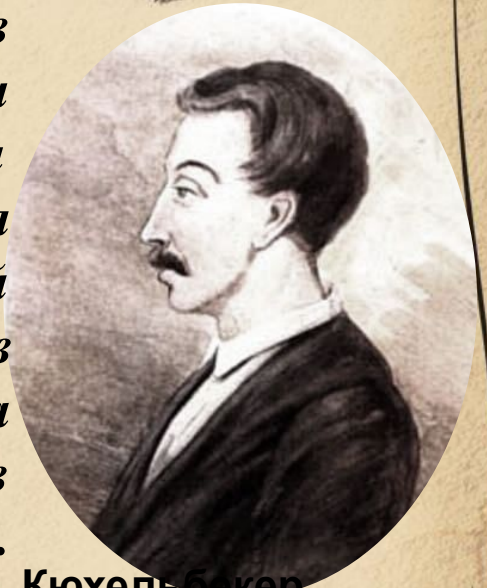
Кюхельбекер Вильгельм Карлович. Гравюра художника И. Матюшина