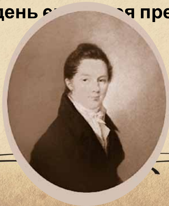
Пуцин Иван Иванович. Художник Ф.Верне

Поэта дом опальный, О Пущин мой, ты первый посетил; Ты усладил изгнанья день печальный, Ты в день е... я превратил.