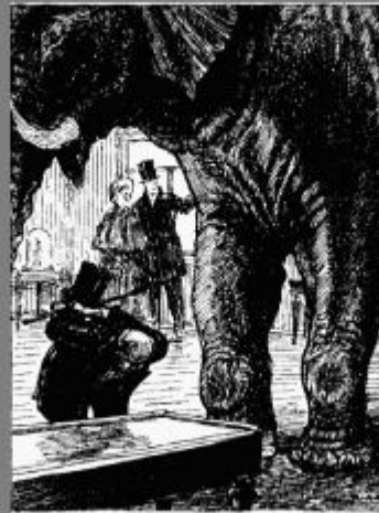
Иллюстрация к басне И. А. Крылова "Любопытный"