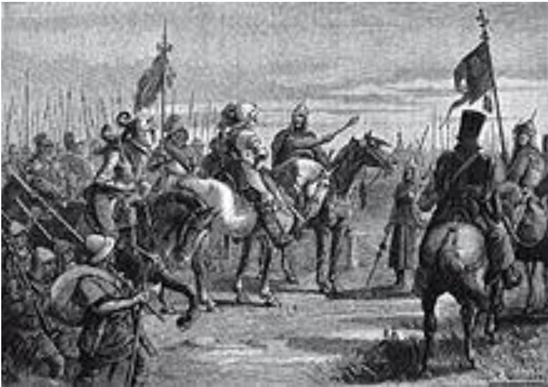
Князь Михаил Скопин-Шуйский встречает шведского воеводу Делагарди близ Новгорода