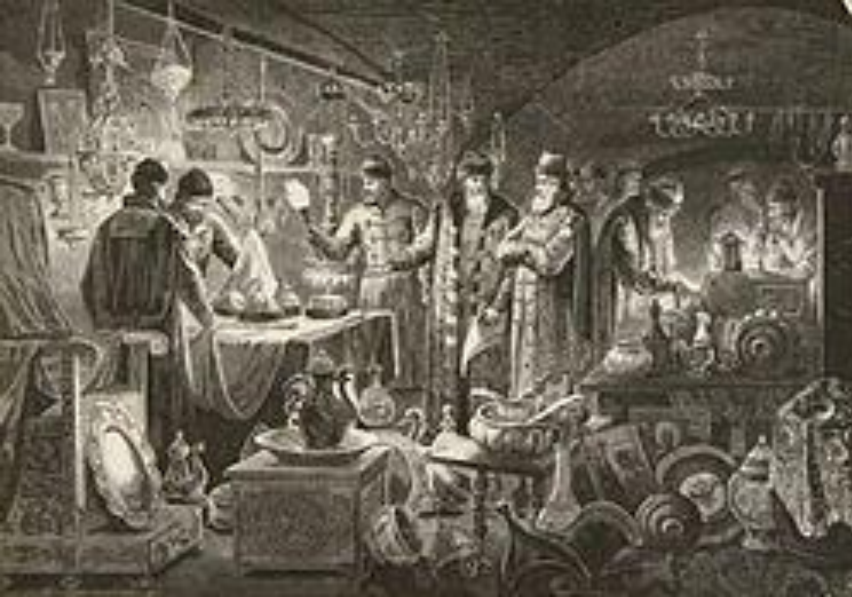
Боярин Шереметев сдаёт сохранённые им царские сокровища.