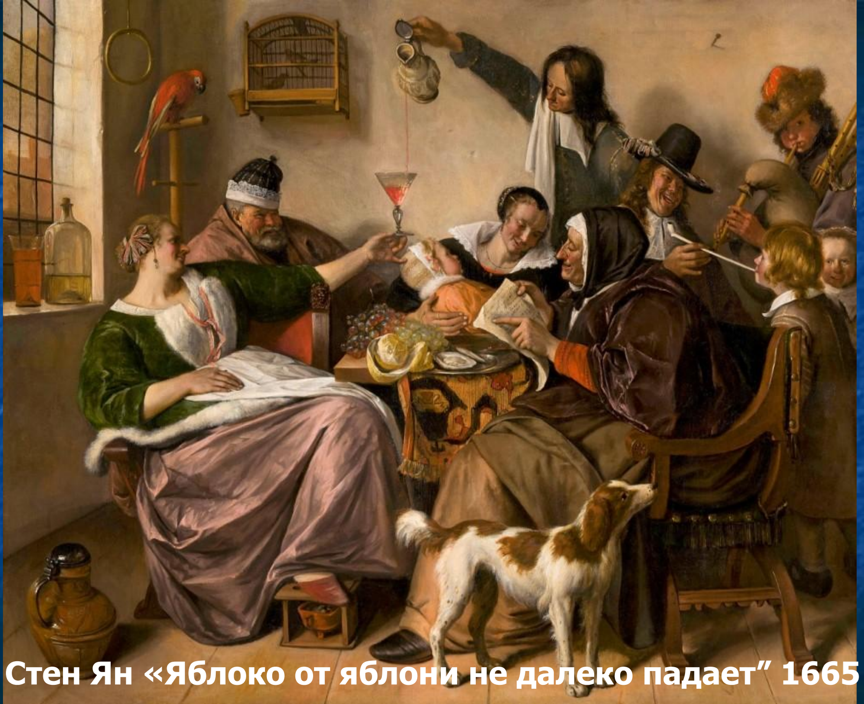
Стен Ян «Яблоко от яблони не далеко падает» 1665 г.,