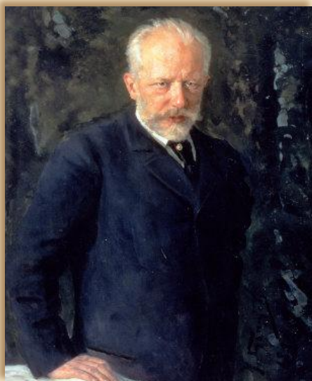
Пётр Ильич Чайковский Балет «Щелкунчик»