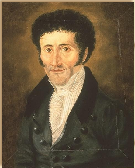
Эрнст Теодор Амадей Гофман Сказка «Щелкунчик и мышинный король»