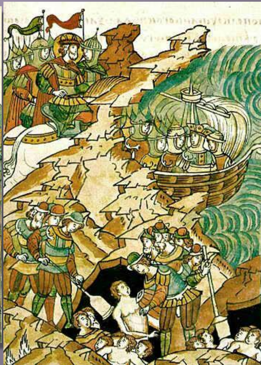
Миниатюра «Погребение павших шведов»