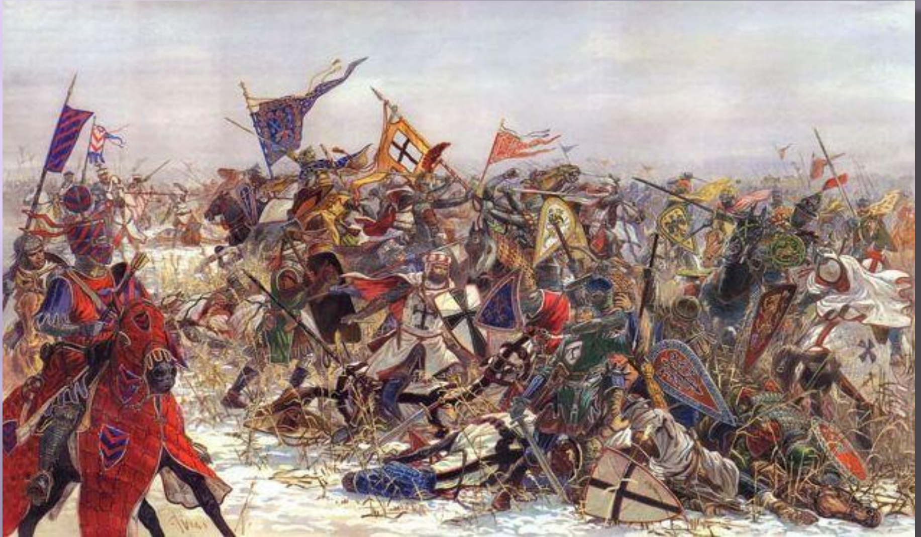
Чудское озеро. 1242 год.

Потом он пошел в Чудскую землю, во владения Ордена, войска которого наголову разбили один из русских отрядов. Когда Александр узнал об этом, он отступил к Псковскому озеру и стал дожидаться неприятеля на льду, который был еще крепок.