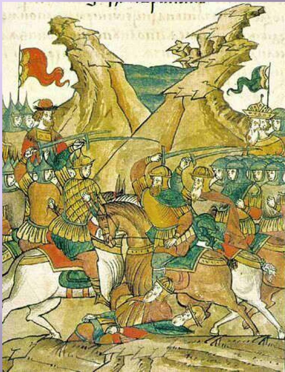
Миниатюра «Войско Александра Невского сокрушает шведов»