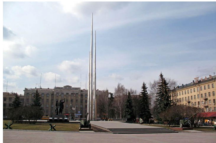
Мемориал в честь героев - защитников Тулы.

В те суровые дни Тула выстояла. Враг не смог захватить город. За мужество и героизм, проявленные горожанами, город был награжден званием "Город-Герой".