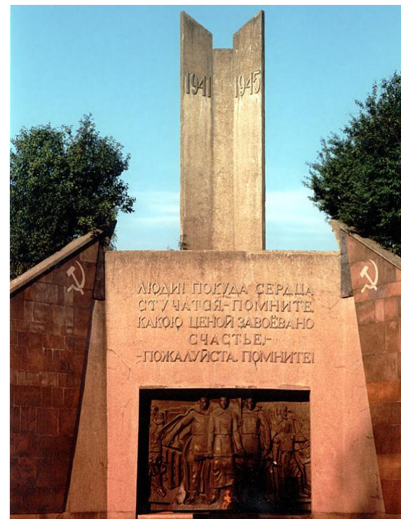
Город-герой Смоленск. Курган Бессмертия

25 сентября 1943 года в результате Смоленской наступательной операции («Суворов») войсками западного фронта Смоленск был освобожден от гитлеровцев.