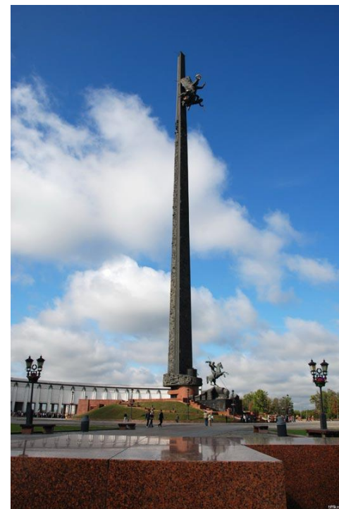
Город-герой Москва. Главный монумент мемориала Победы.

12 декабря 1941 года мир облетело знаменательное сообщение Московского радио: «6 декабря 1941 года войска нашего фронта, измотав противника в предшествующих боях, перешли в контрнаступление против его фланговых группировок. В результате начатого наступления обе эти группировки разбиты и спешно отходят, бросая технику, вооружение и неся огромные потери».