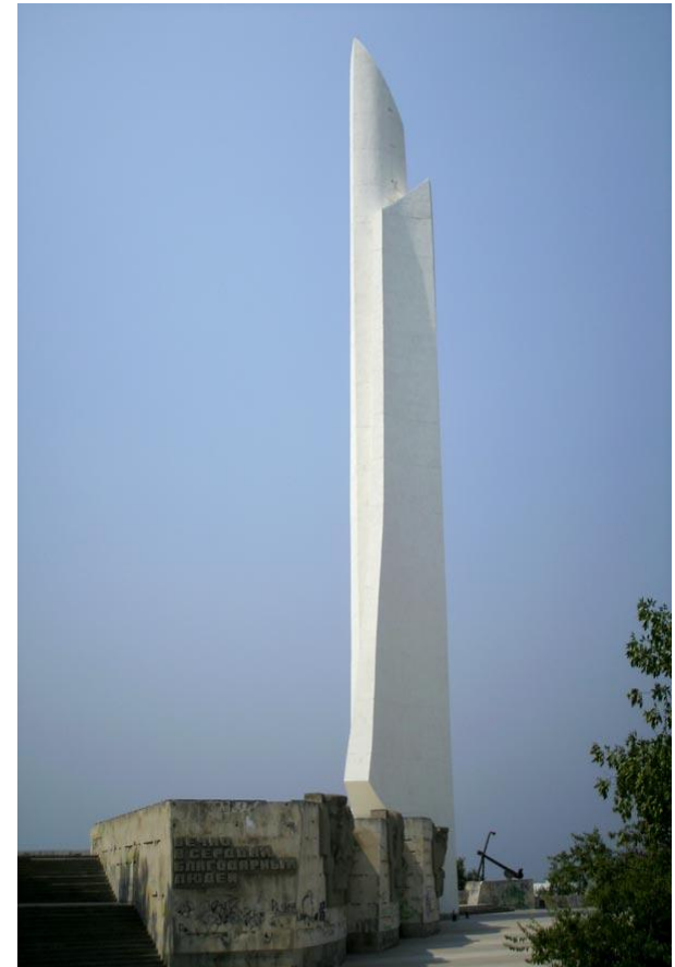
Обелиск «Городу-герою Севастополю» «Штык и Парус»

Освобождение Севастополя началось 5 мая 1944 г. в ходе Крымской наступательной операции. Особенно жаркие бои завязались на Сапун-горе, являвшейся ключом вражеской обороны. 9 мая 1944 г. Севастополь - город русской боевой славы - был освобожден