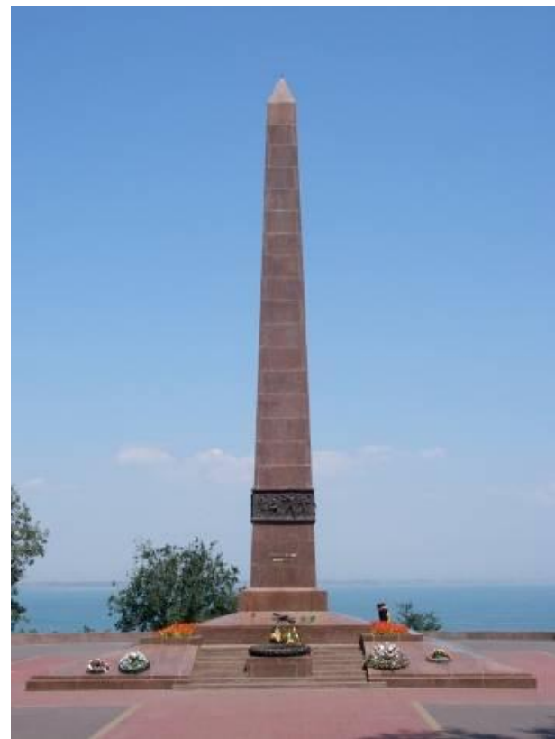
Обелиск Неизвестному матросу на Аллее Славы

За массовый героизм её защитников Одессе присвоено звание "Город-герой".