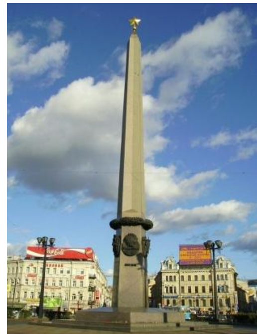
Обелиск "Городу-герою Ленинграду". Установлен в мае 1985 года на Площади Восстания.

В конце января 1944 г. величественный город, площади которого политы потом и кровью героических защитников, был полностью освобожден от вражеской блокады.