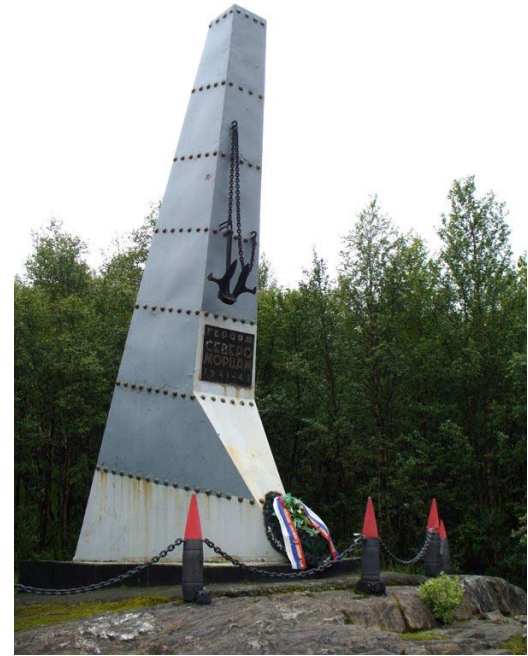
Памятный знак «Героям североморцам»

На Мурманск было сброшено более 181 тысячи зажигательных и четыре тысячи фугасных авиабомб. Было разрушено или сгорело большинство жилых домов и 2/3 предприятий. Осенью 1944 года флот изгнал противника и угроза захвата Мурманска миновала.