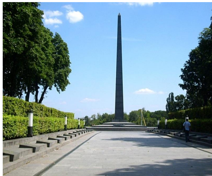
Обелиск и Вечный огонь в парке Вечной Славы в Киеве. Сооружен 6 ноября 1957 года.

В память о событиях 1941-1945 года в городе был воздвигнут Мемориальный комплекс "Национальный музей истории Великой Отечественной войны" - еще одно свидетельство того, что подвигу народа-победителя - жить в веках.