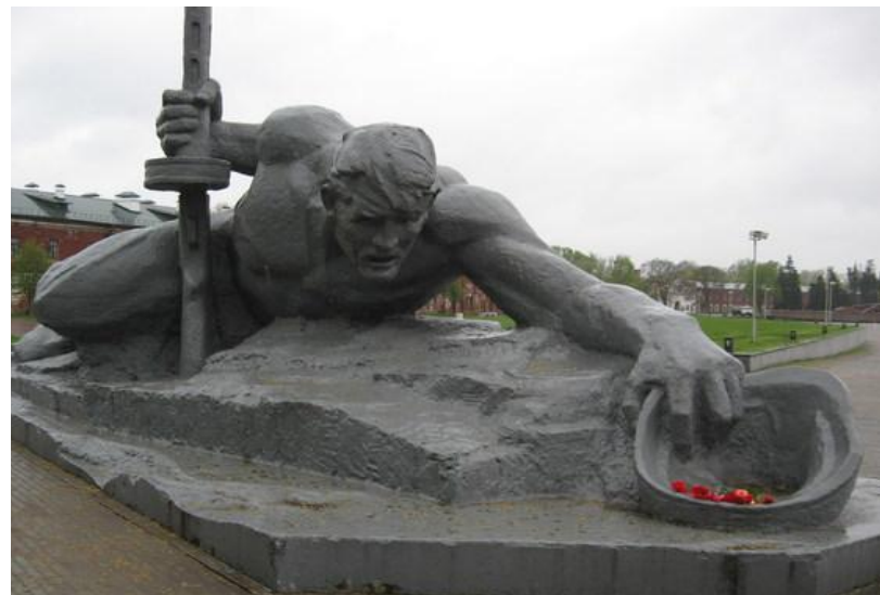
В мемориальном комплексе "Брестская крепость-герой". Скульптура "Жажда".

Немецкое командование рассчитывало захватить крепость в течение нескольких часов, но 45-я дивизия вермахта застряла в Бресте на неделю и со значительными потерями еще целый месяц подавляла отдельные очаги сопротивления героев-защитников Бреста. В результате, Брестская крепость стала символом мужества, героической стойкости и доблести времен Великой Отечественной войны.