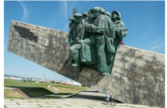
Мемориал "Малая земля".

Разрушенный до основания, весь в дыму пожарищ, Новороссийск выстоял и победил.