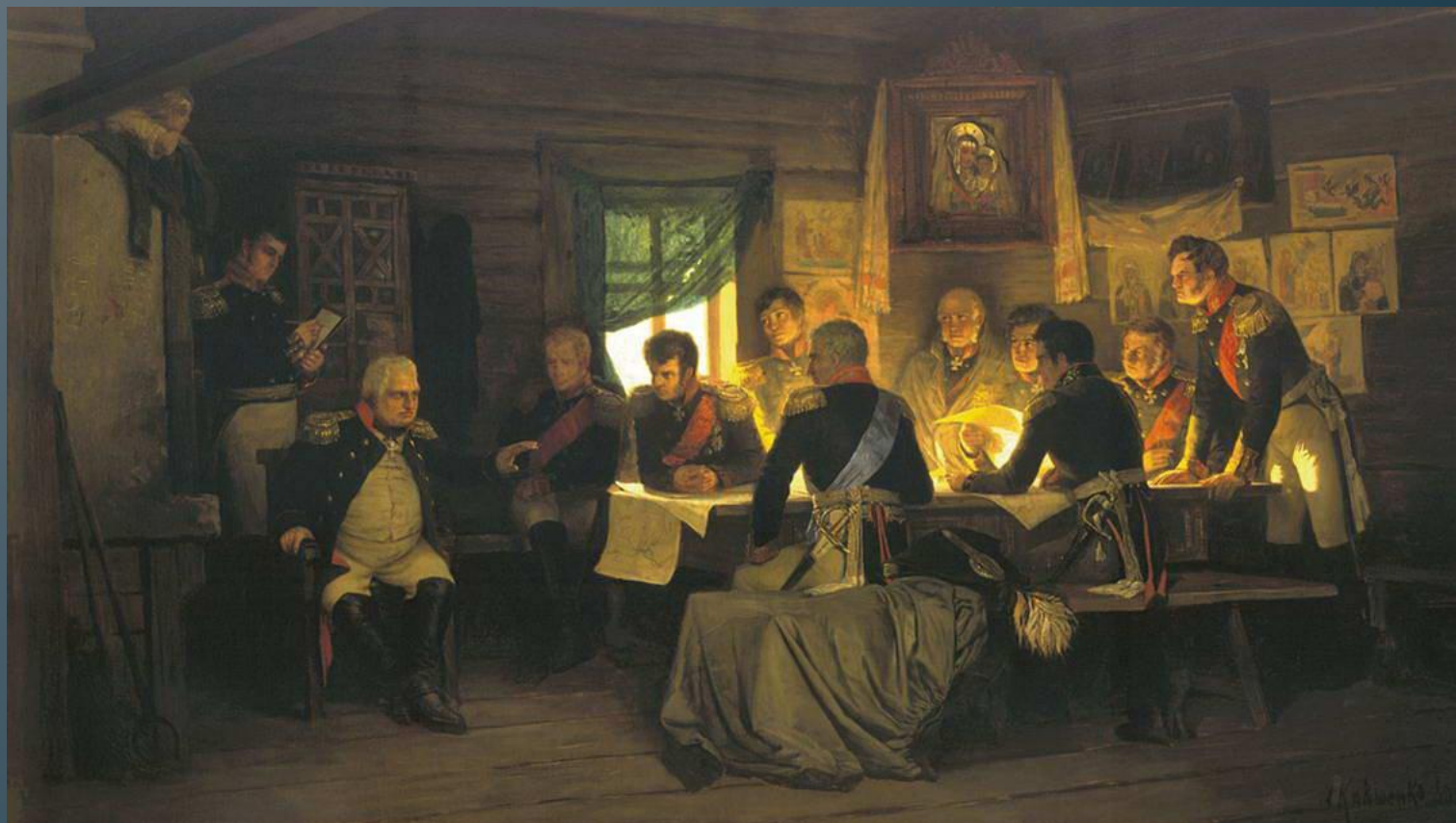
А. Кившенко «Военный совет в Филях» (1880)