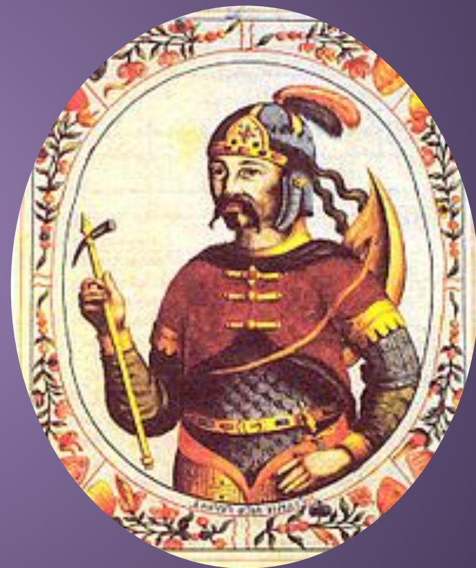
Рюрик, миниатюра из «Царского титулярника» XVII век