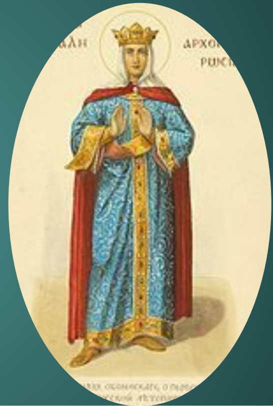
Архонтисса Ольга. Рисунок из старой книги