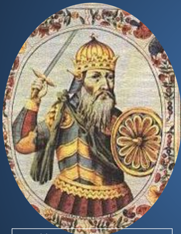
Условный портрет Святослава Игоревича из Царского титулярника, XVII в.