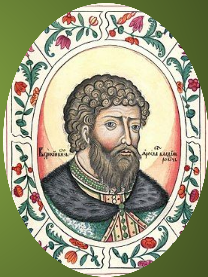
Портрет из «Царского титулярника» XVII века