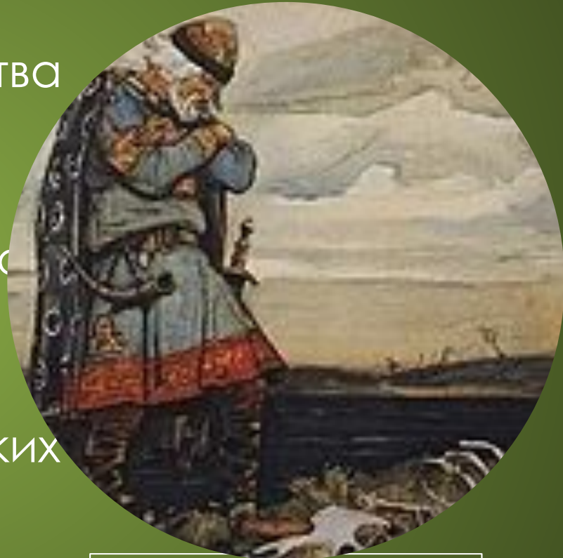
Олег у костей коня. В. М. Васнецов, 1899