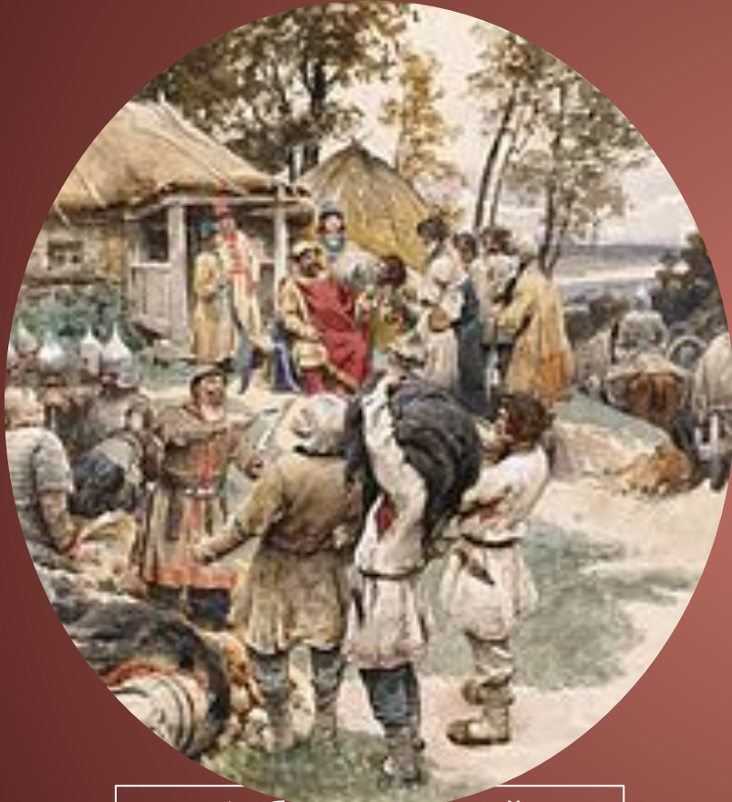
Лебедев, Клавдий Васильевич. Князь Игорь собирает дань с древлян в 945 году («Полюдь»)