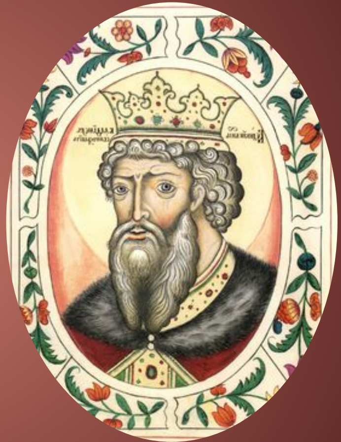
Портрет из «Царского титулярника» XVII века