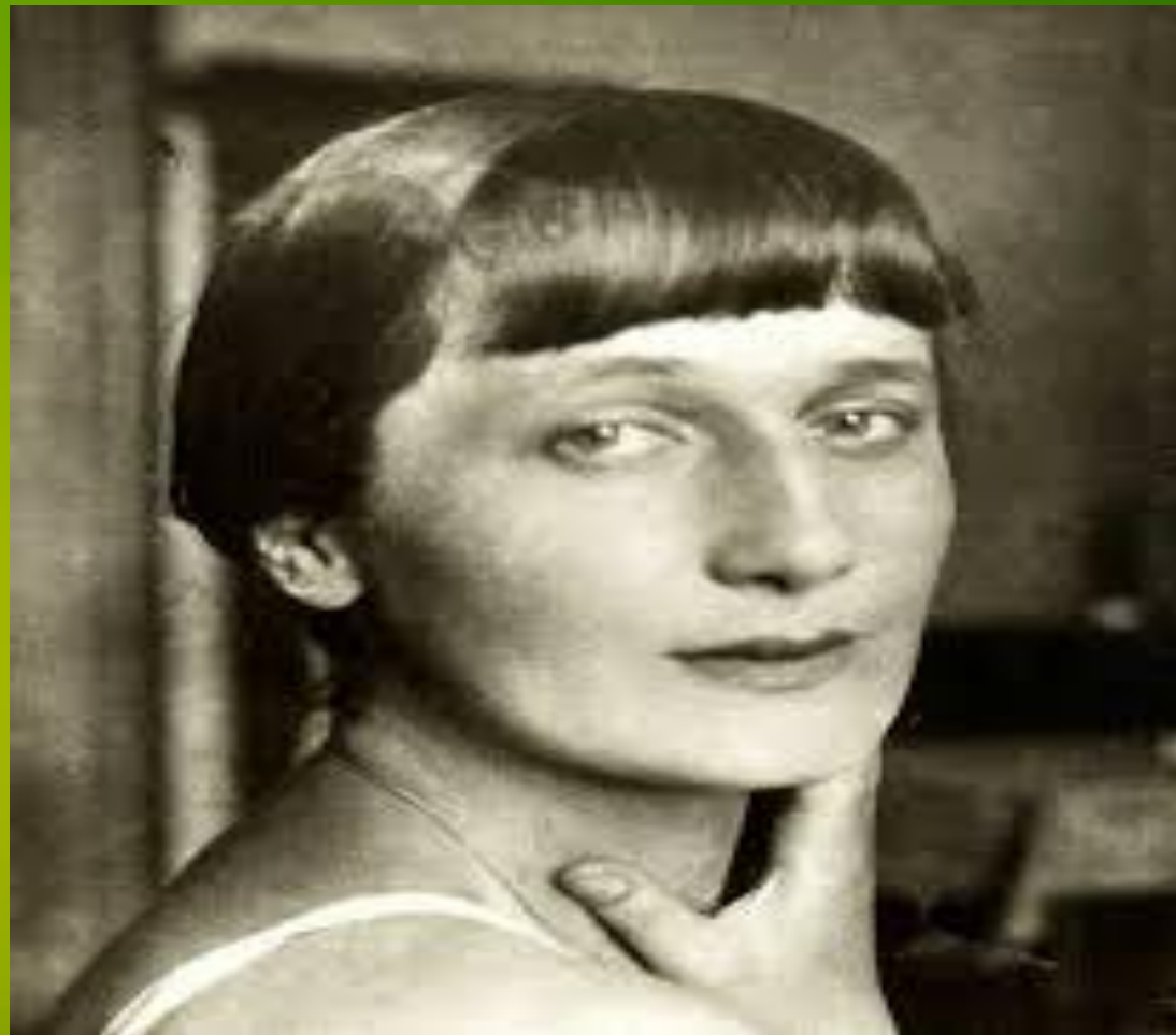
АННА АНДРЕЕВНА АХМАТОВА 1889-1966