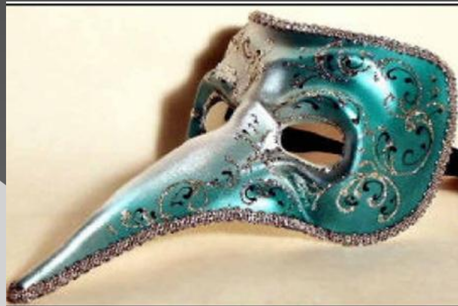
Art.: MS3012 NASONE