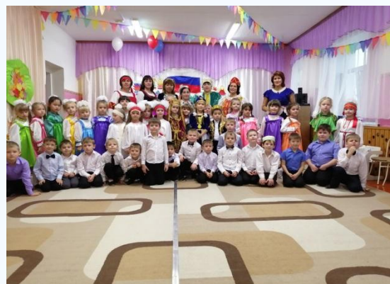
Детский сад «Солнышко корпус №1, № 2.