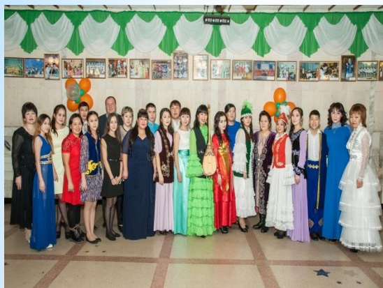
Участники 5- районного конкурса «Жас канат»