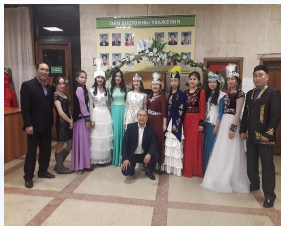
Участники 6 - районного конкурса «Жас канат»