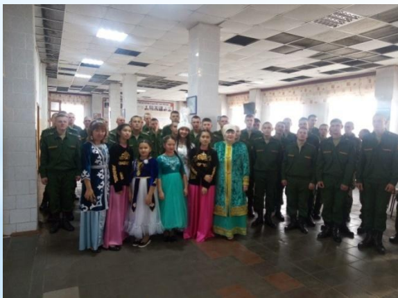
«Фестиваль национальных кухонь», в/ч № 98555 в Тарическом.