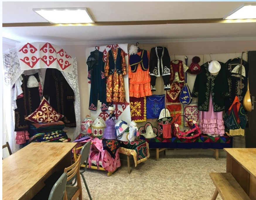
Постоянно действующая выставка в фойе Центра национальных культур «Достык – Дружба»