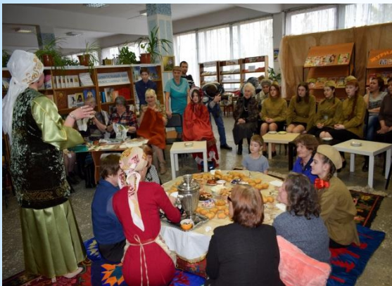
Библионочь «Церемония чаепития»