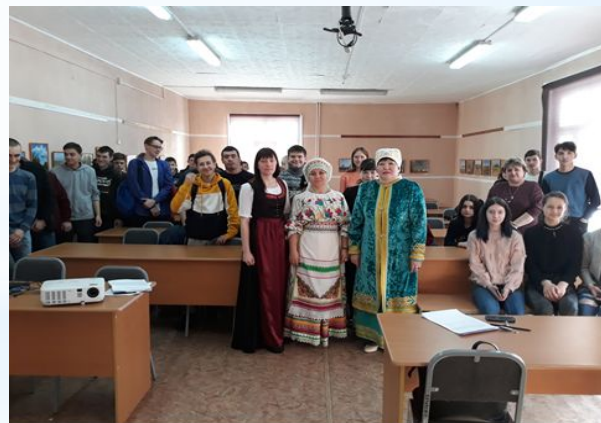
В филиале БПОУ ОО «Сибирский профессиональный колледж»