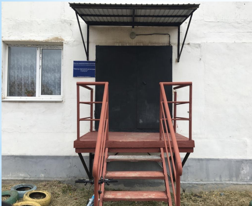
Фасад здания «Центра национальных культур»