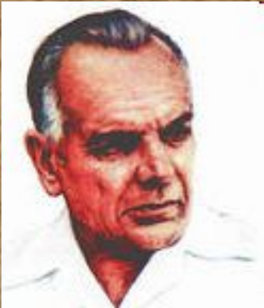
Константи н Георгиевич Паустовски й (1892-1968)