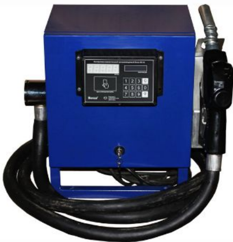
Автоматическая мини ТРК Benza 36 напорная