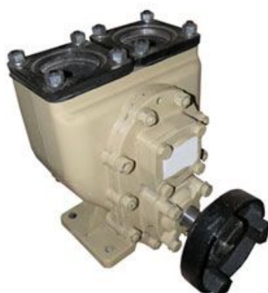
Насос СВН-75 Benza