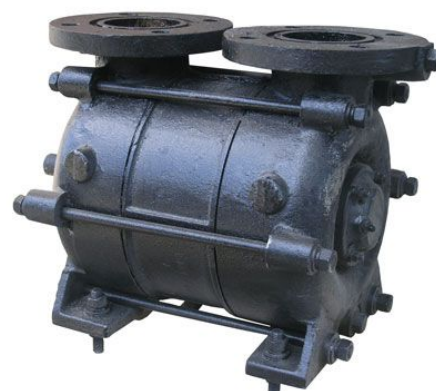
Насос СВН-80 В (две крыльчатки)