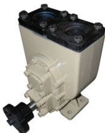
Насос СВН-50 Benza