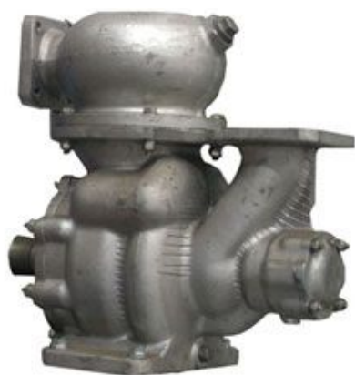
Насос СЦЛ 20/24