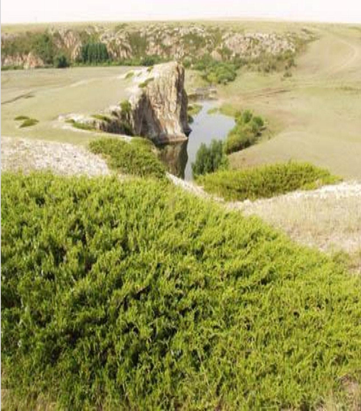
Уртазымски е скалы