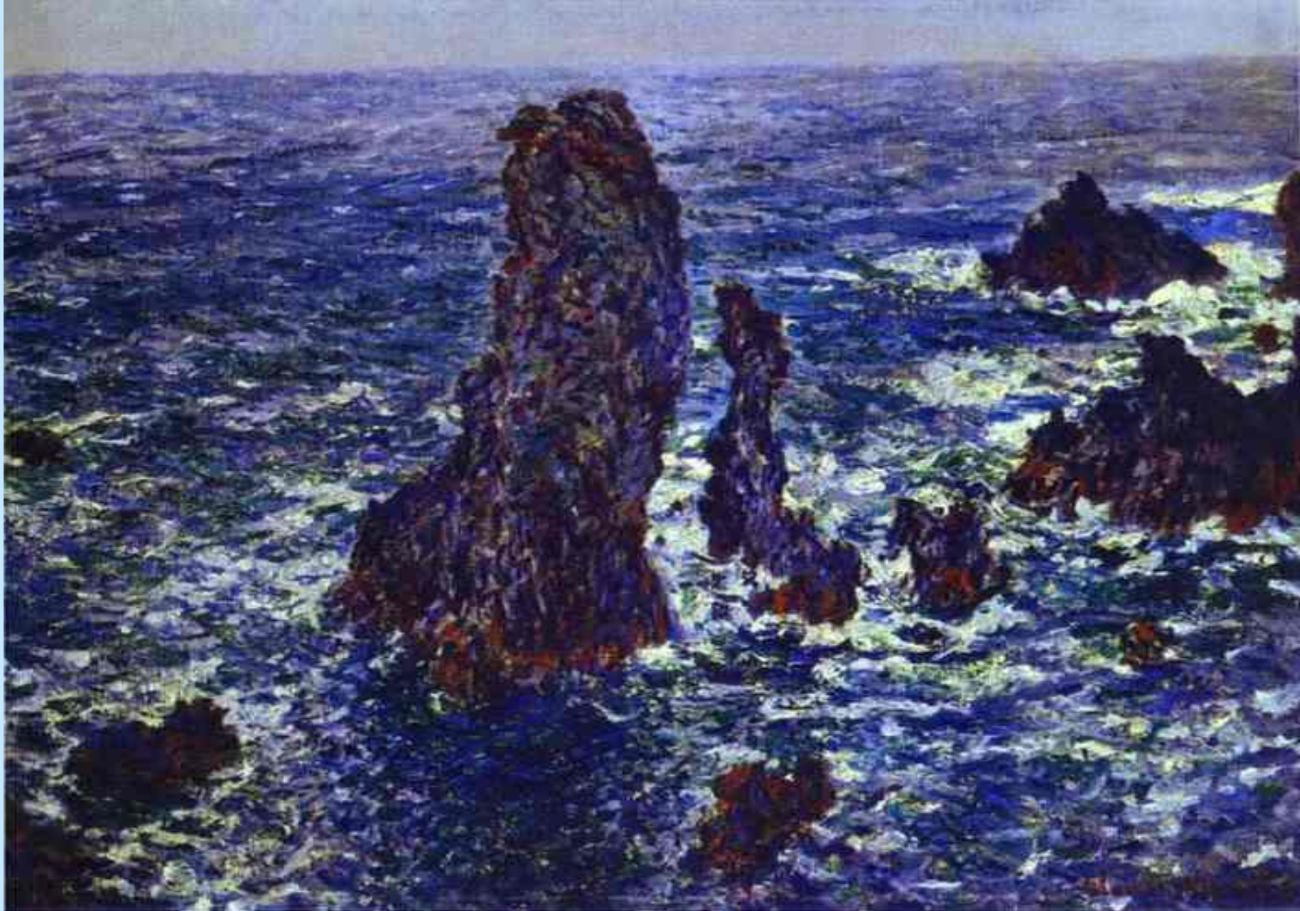
СКАЛЫ В БЕЛЬ-ИЛЬ. 1886