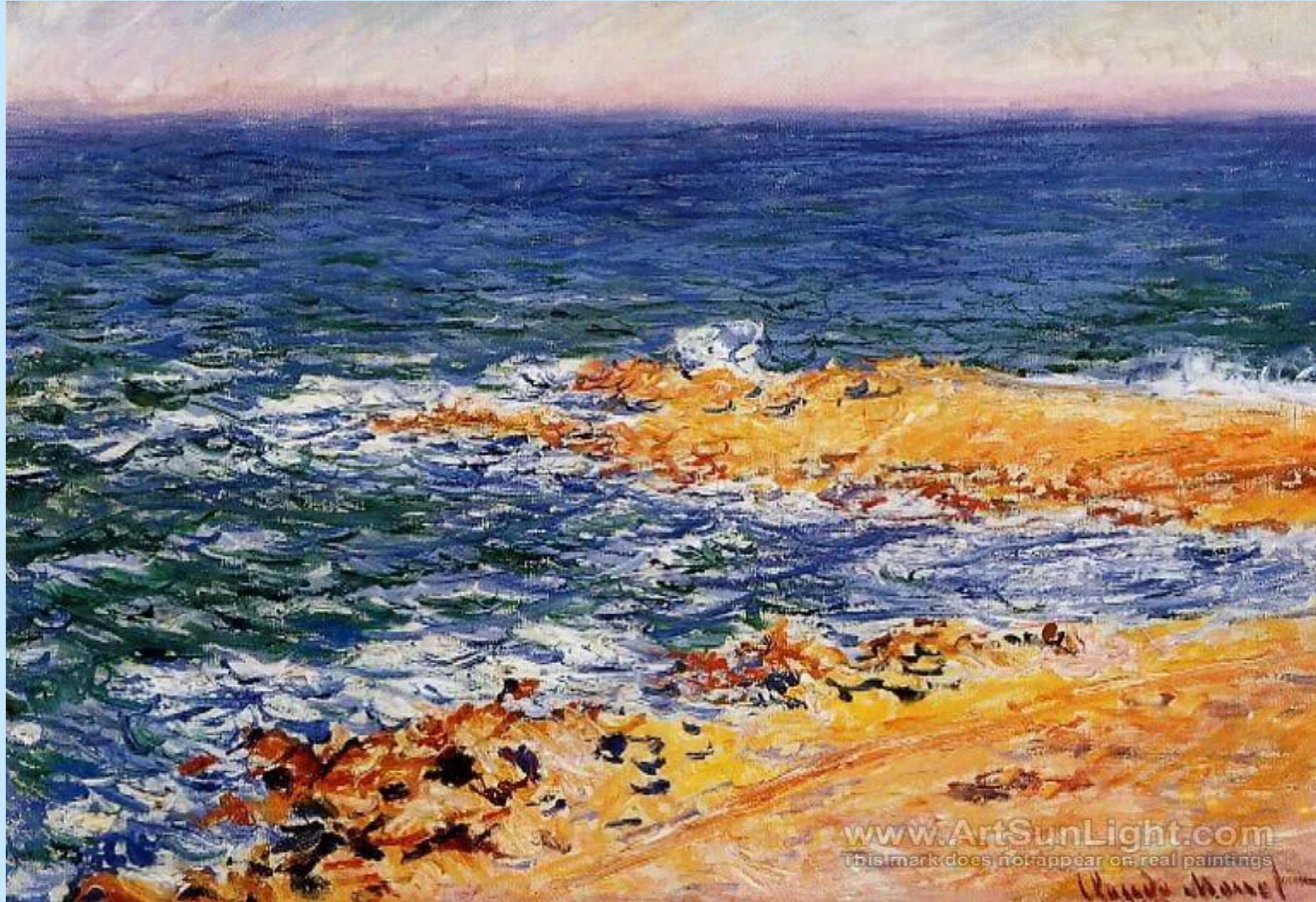
ГОЛУБАЯ БЕЗДНА МОРЯ В АНТИБАХ. 1888