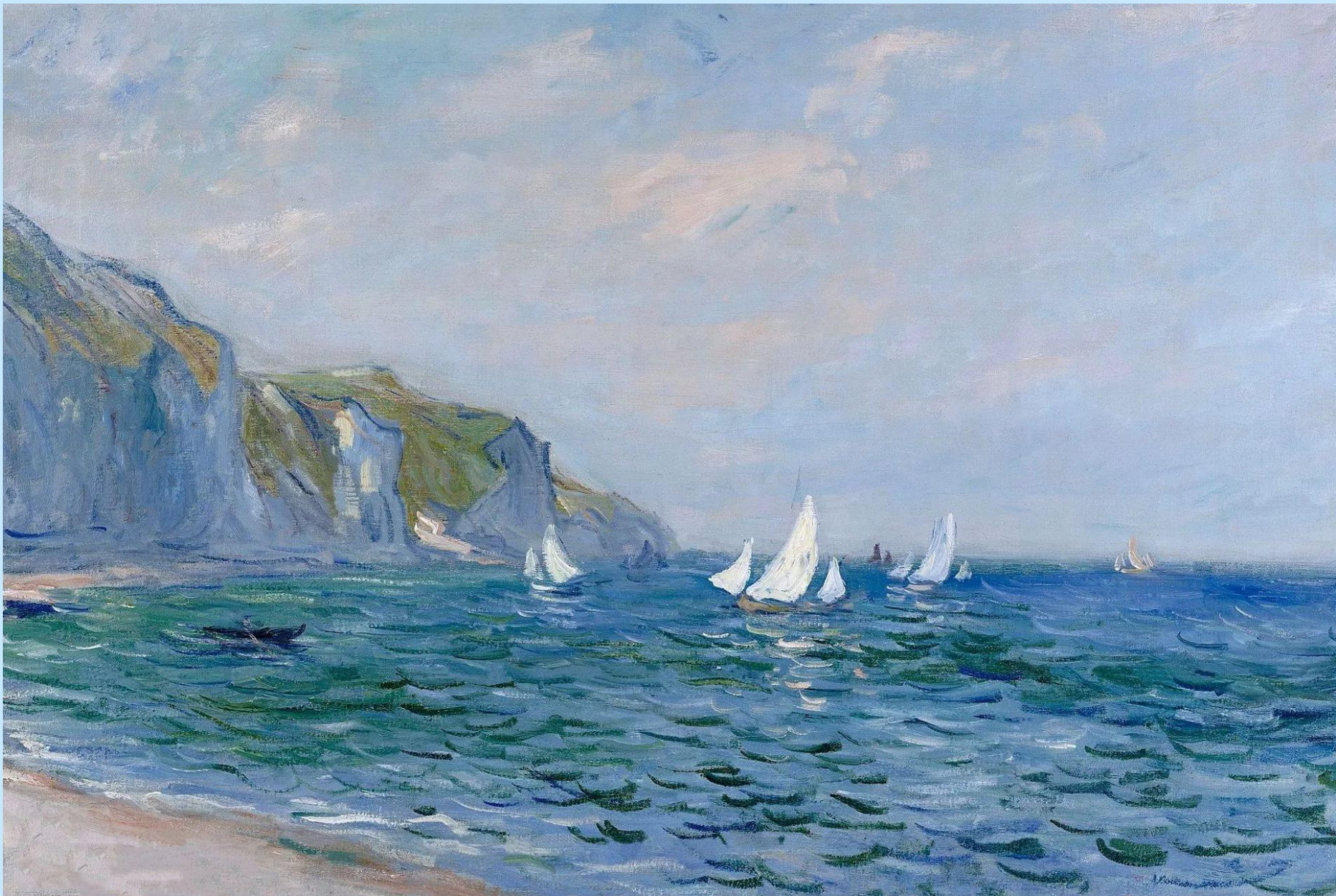
СКАЛЫ И ПАРУСНИКИ В ПУРВИЛЕ. 1882