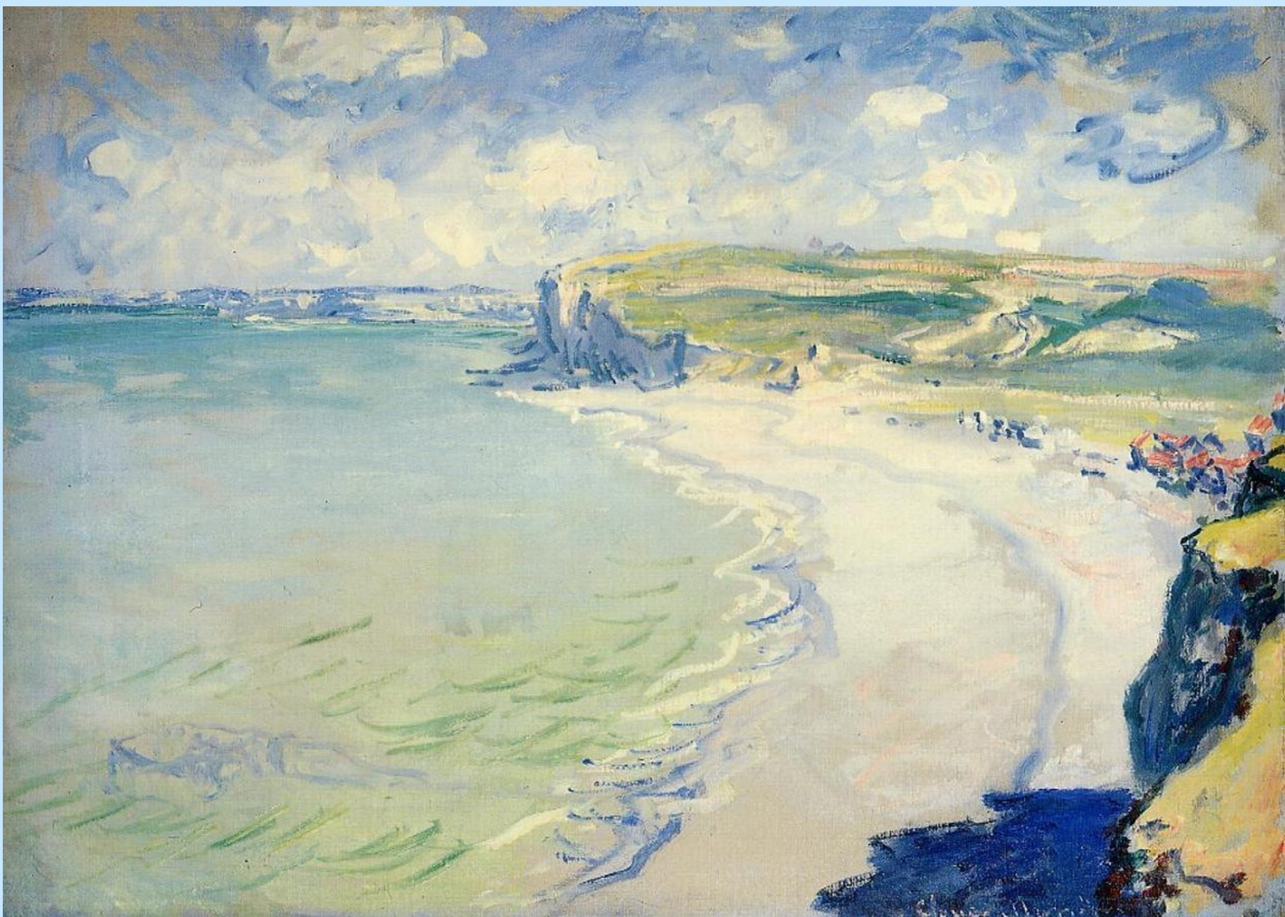
ПЛЯЖ В ПУРВИЛЕ. 1882