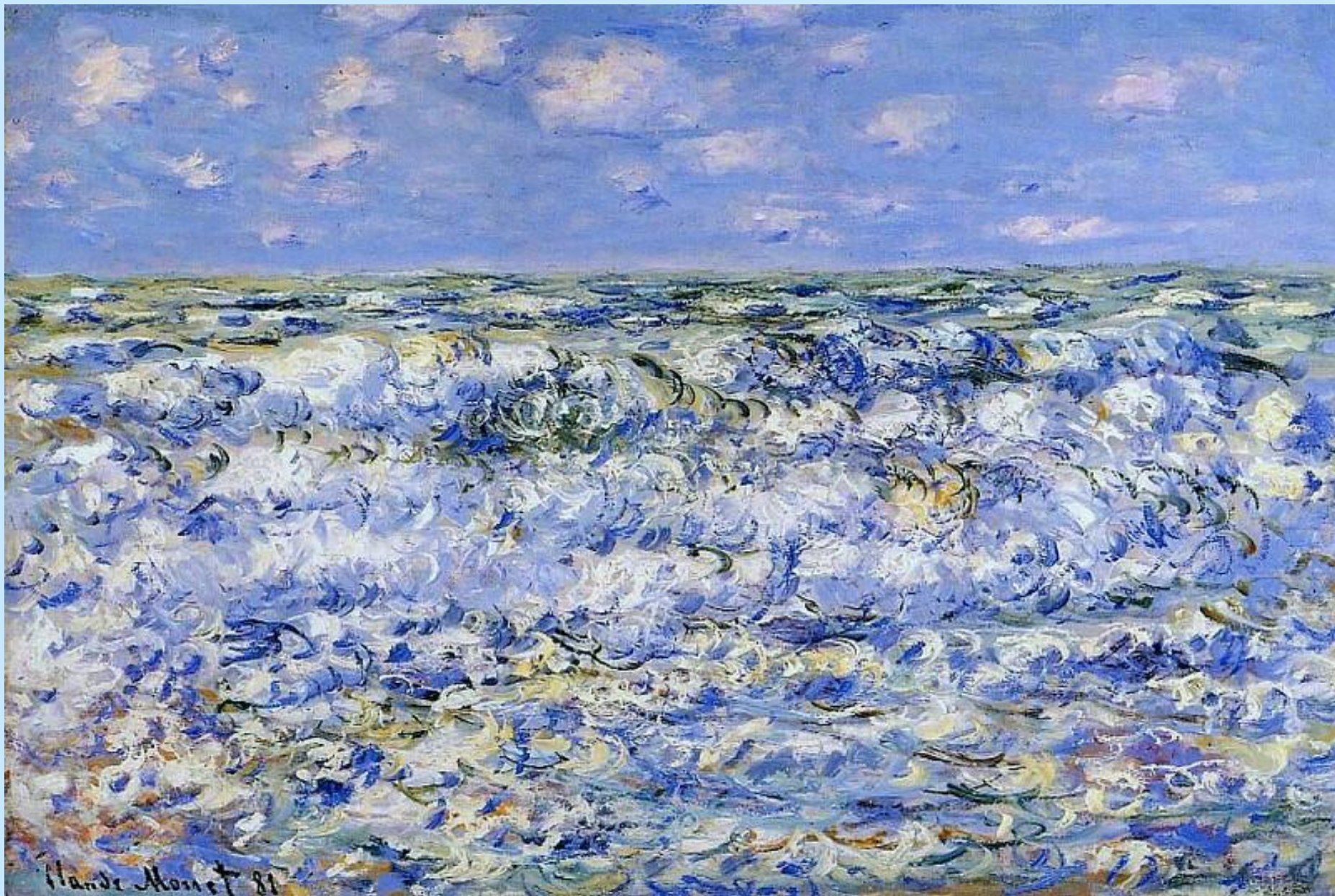
ВОЛНЫ. 1881