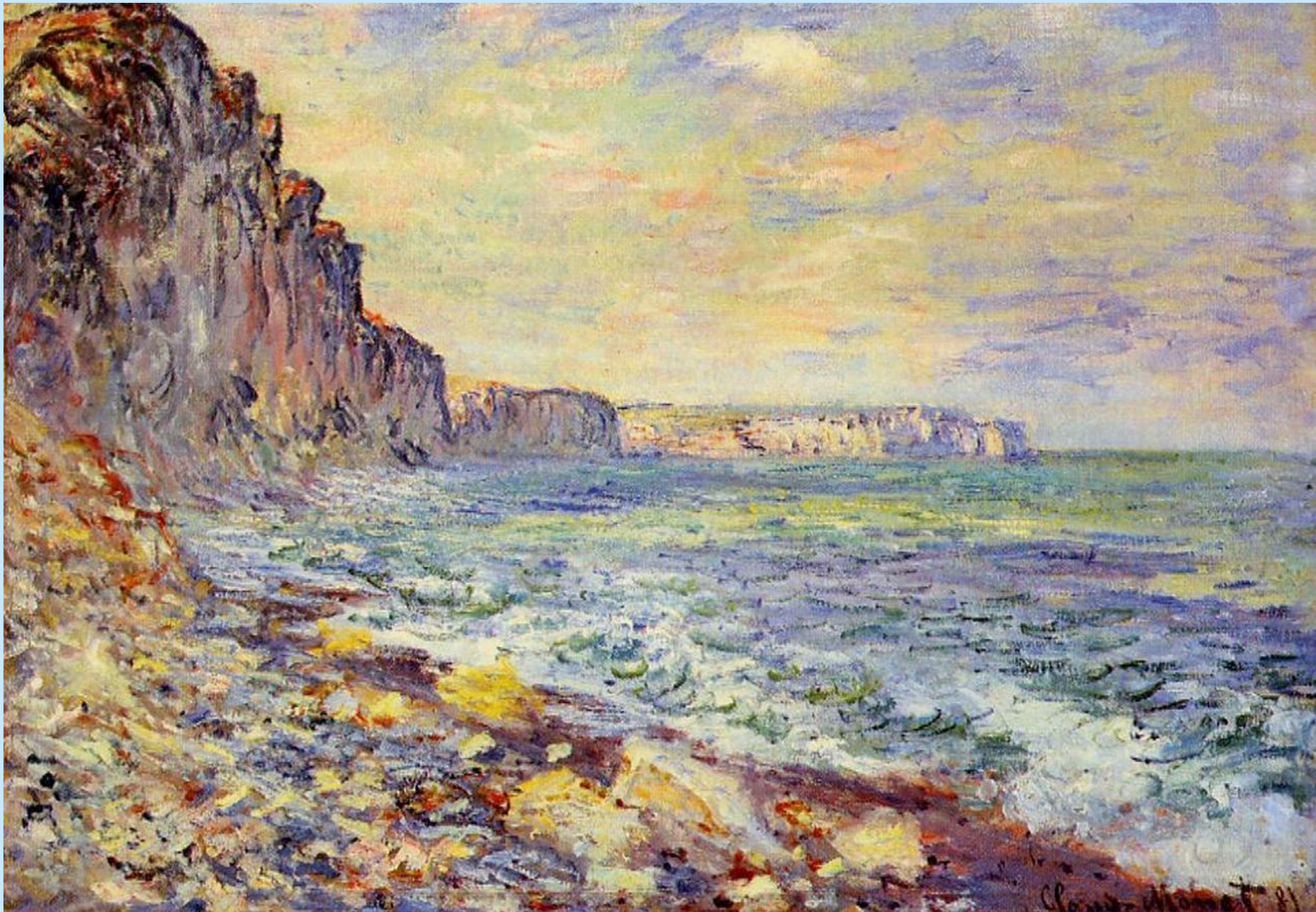
УТРО НА МОРЕ. 1881 OckYandex.kz