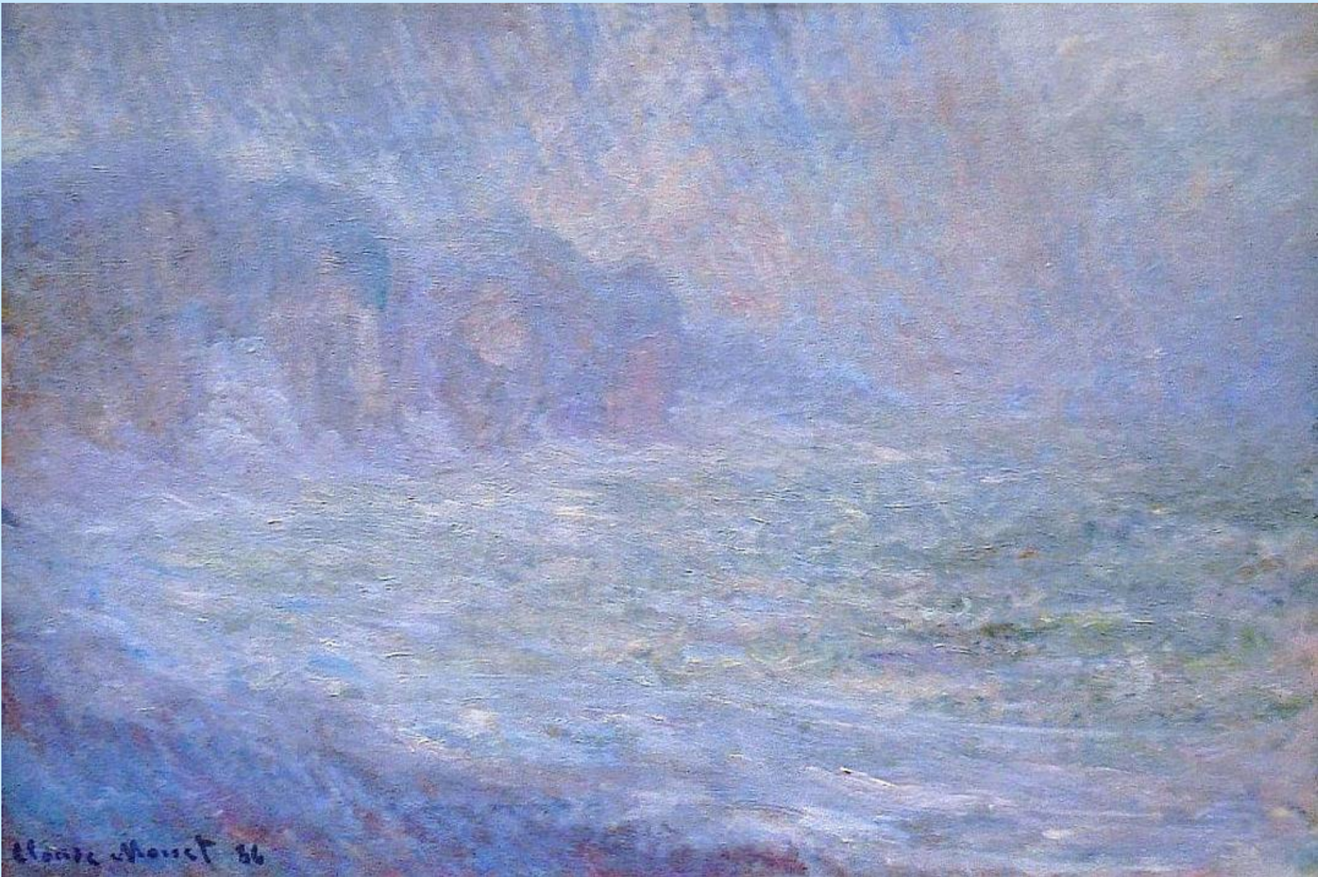
СКАЛЫ В ПУРВИЛЕ, ДОЖДЬ. 1886