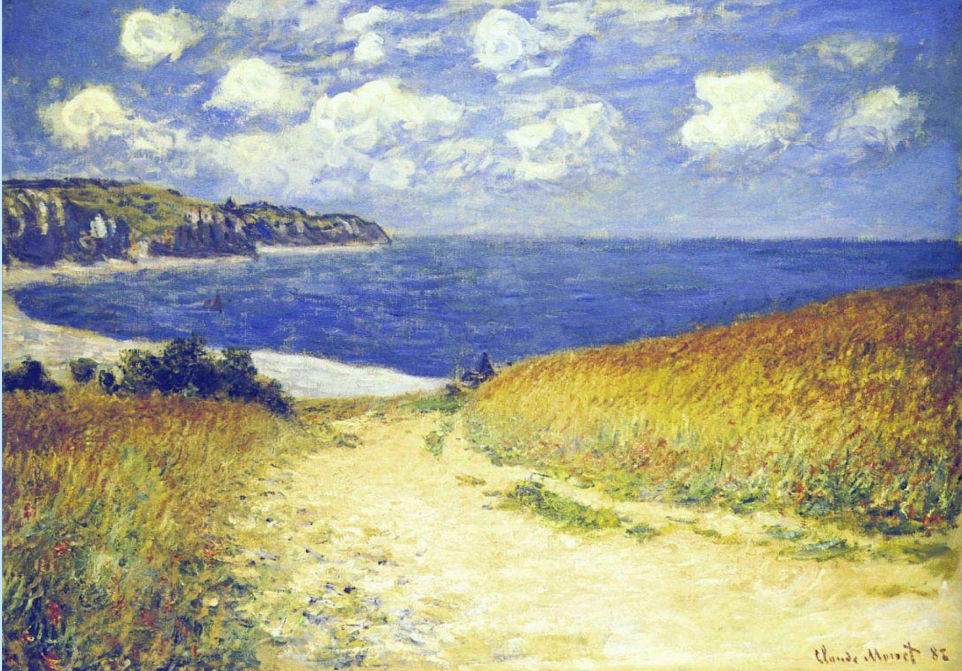
ДОРОГА БЛИЗ ПУРВИЛЯ. 1882