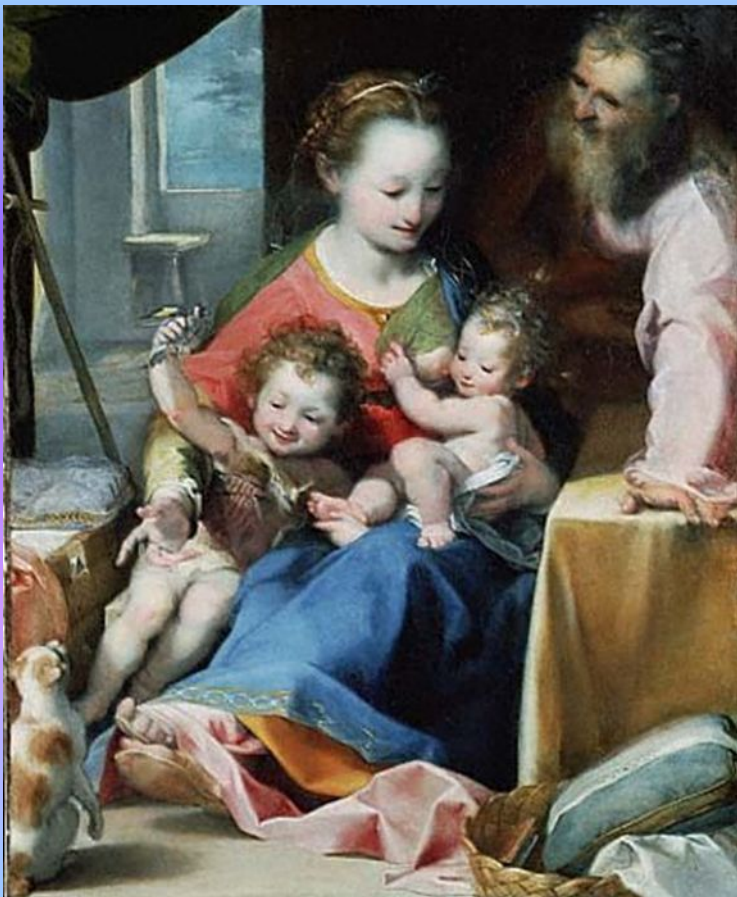
Рембрандт «Мадонна с младенцем И Св. Иосифом»

Женщина, мать стала воплощением кисти великих мастеров искусства: Рембранта, Венецианова, Тропинина, Серова и других.