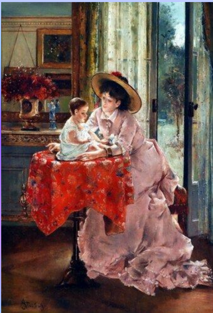
художник Альфред Эмиль-Леополь Стевенс (1823-1906) - Счастливая мама