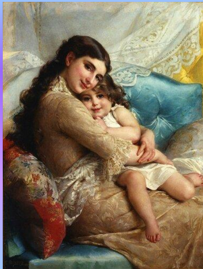
художник Эмиль Мюнье (1840-1895) - Портрет матери и дочери