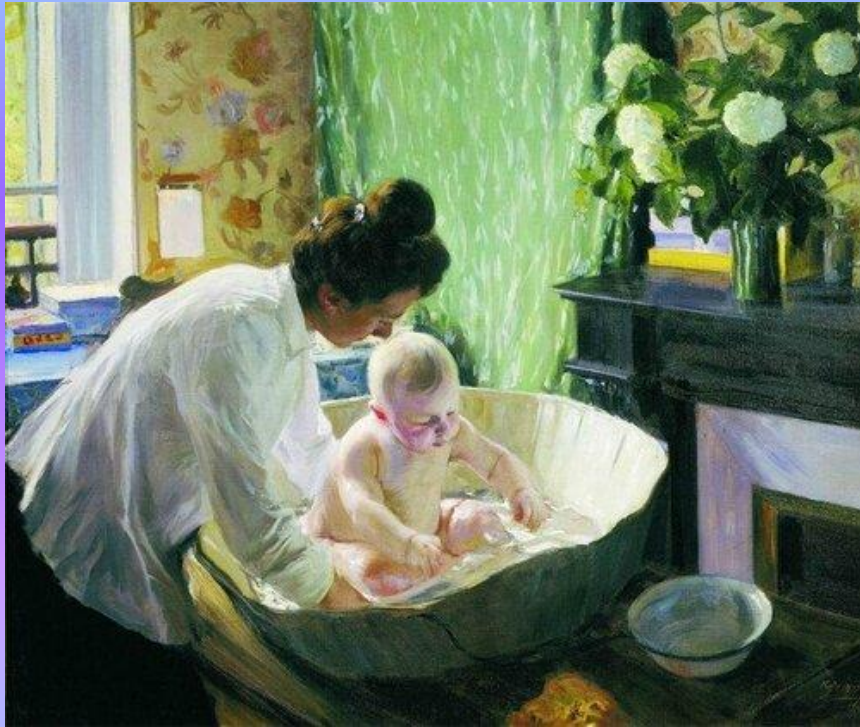
Кустодиев, Борис Михайлович (1878-1927) Утро