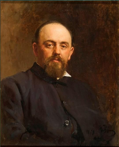
Савва Иванович Мамонтов