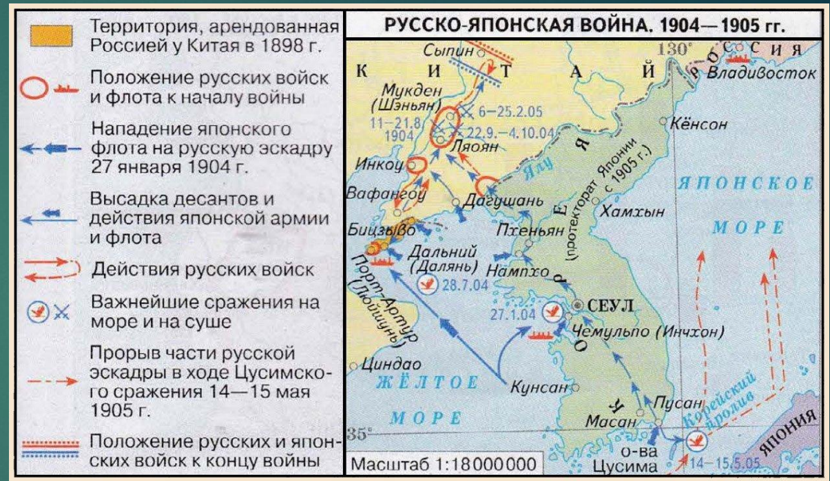
Карта русско-японской войны 1904-1905