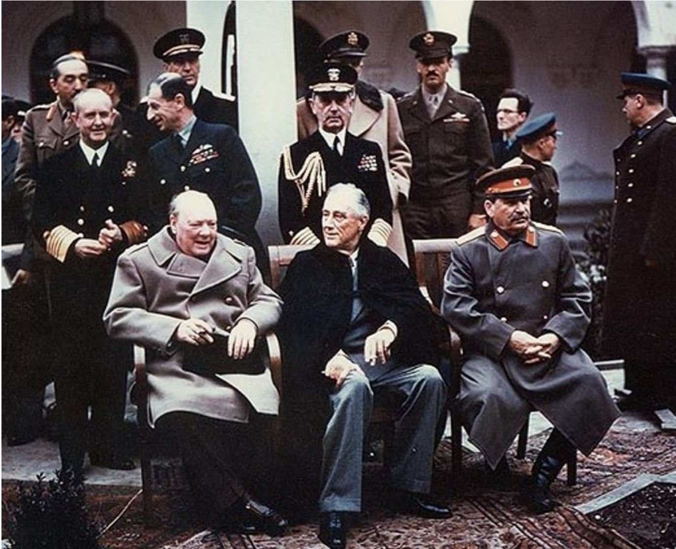
Черчилль, Рузвельт и Сталин у Ливадийского дворца Крымская конференция