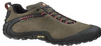
Летняя легкая обувь

Обувь такого типа рассчитана на высокие температуры. Система вентиляции позволяет беспрепятственно испарять влагу .В случае промокания быстро высыхает.