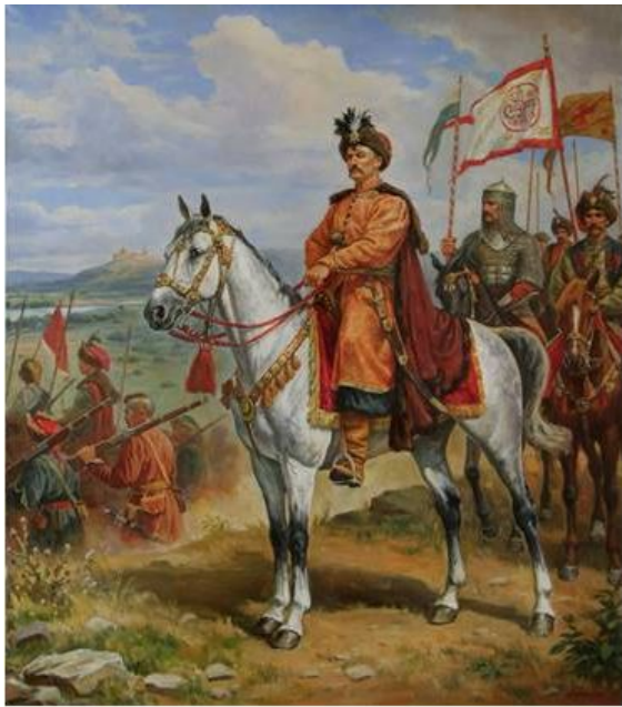
Богдан Хмельницкий. Картина Орленова А.

Тем временем 1 октября 1653 г. в Москве состоялся Земский Собор, на котором было принято решение о воссоединении Малороссии с Россией и начале войны с Польшей. Для официального оформления этого решения в Малороссию было послано Великое посольство во главе с боярином В. Бутурлиным, и 8 января 1654 г. в Переяславле состоялась Великая Рада, на которой были одобрены все статьи договора, определявшие условия вхождения Малороссии в состав России на правах автономии.