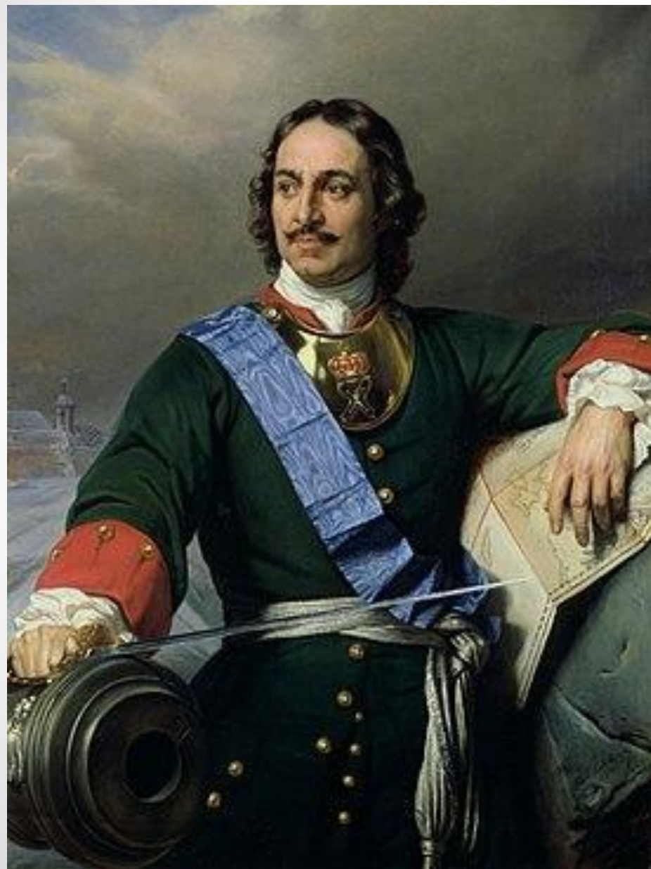
Романтизированный портрет Петра I Поль Деларош, 1838