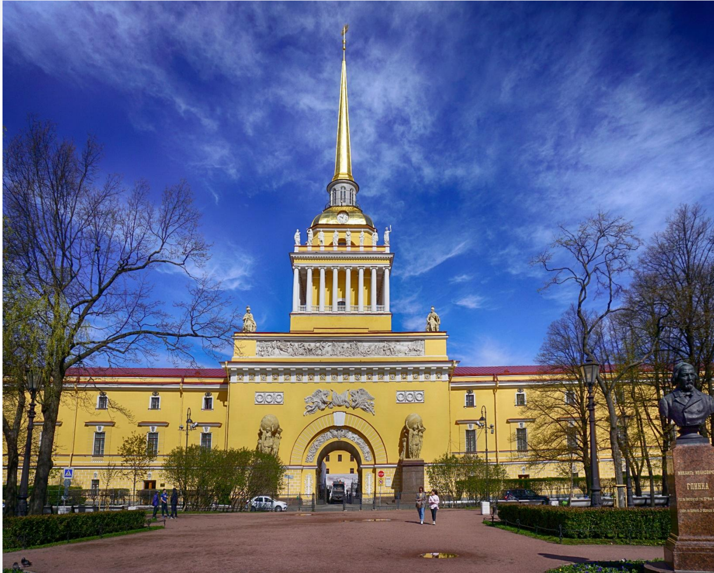
Здание Главного адмиралтейства