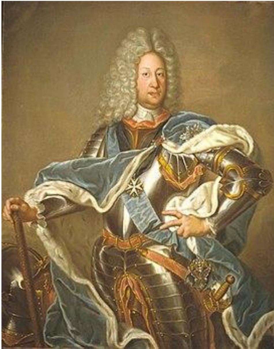
Аргунов И.П. «Портрет фельдмаршала графа Б.П.