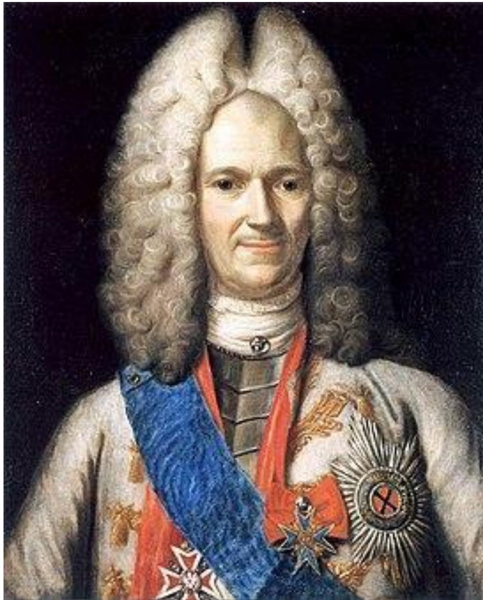
Портрет А. Д. Меншикова. 1716—1720 гг., неизвестный