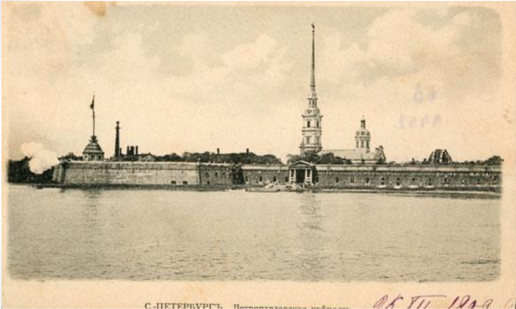
Петропавловская крепость. Открытка начала XX века