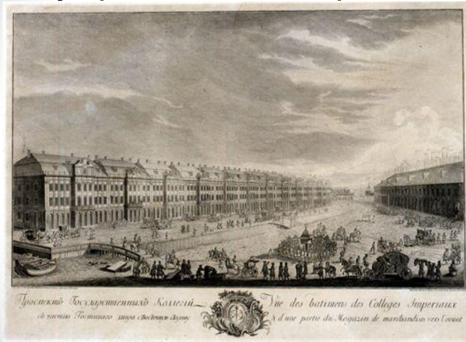
Здание Двенадцати коллегий (гравюра 1753 года)