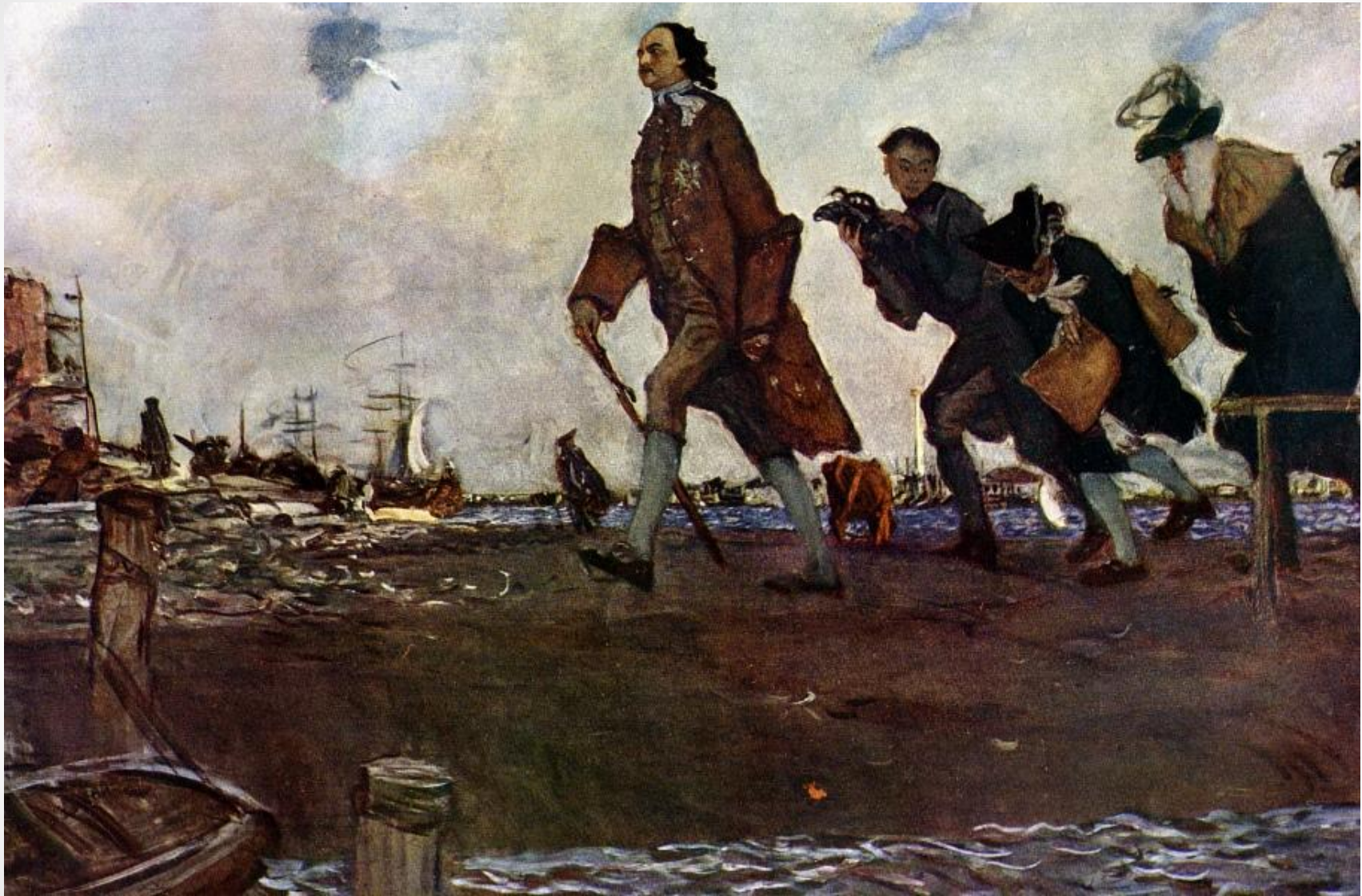
Серов В.А. Петр I. 1907 год. Государственная Третьяковская галерея