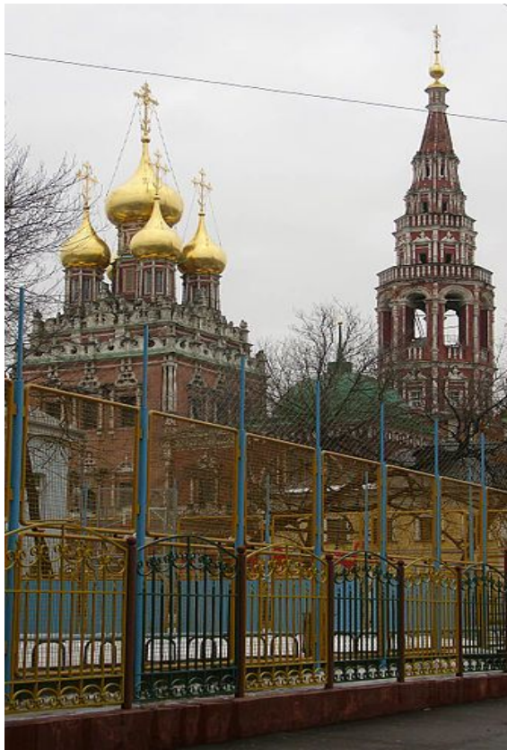
Ц. Воскресения в Кадашах