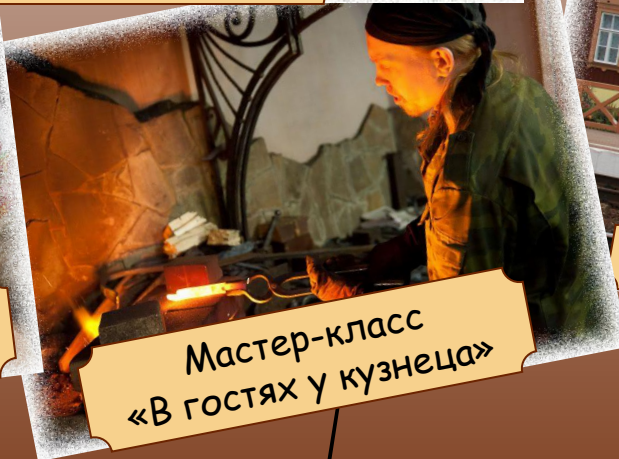
Мастер-класс «В гостях у кузнеца»