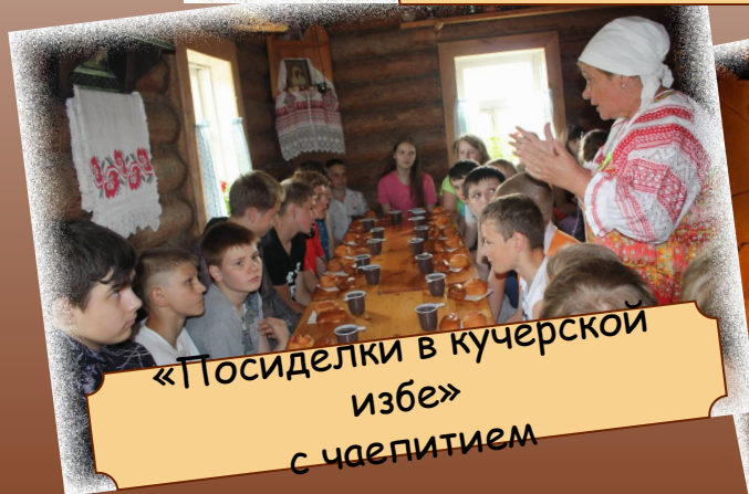
«Посиделки в кучерской избе» с чаепитием