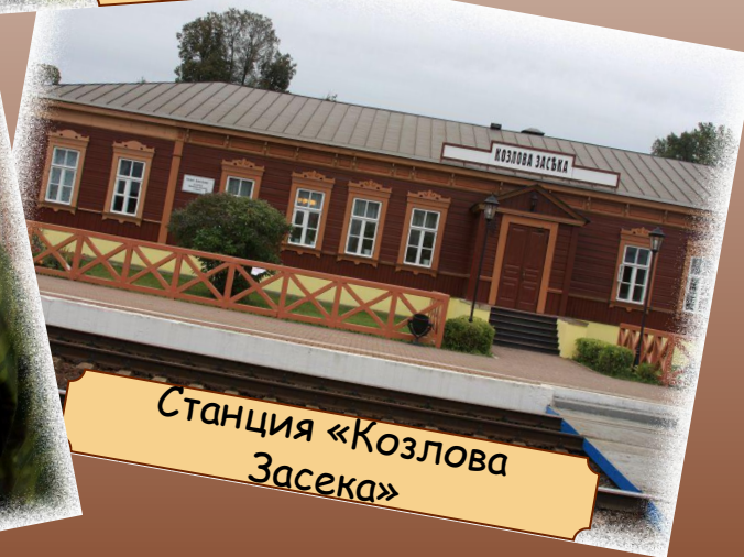
Станция «Козлова Засека»

10:00-15:00 "СЛЫШУ ГОРДОЕ СЛОВО ТОЛСТОГО" -