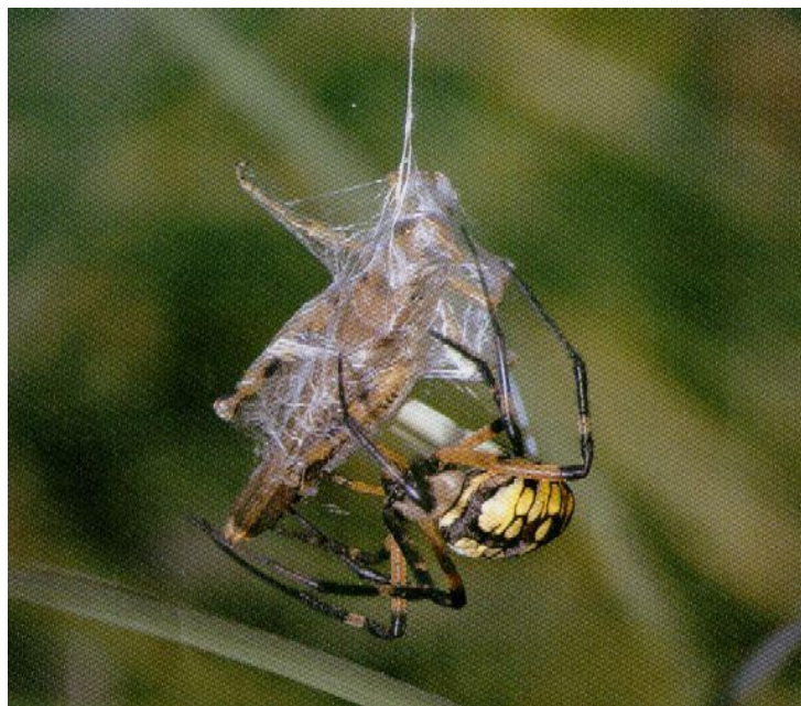
Садовый паук и кузнечик

Иногда пауки заворачивают пойманных насекомых в паутину, чтобы съесть позже.