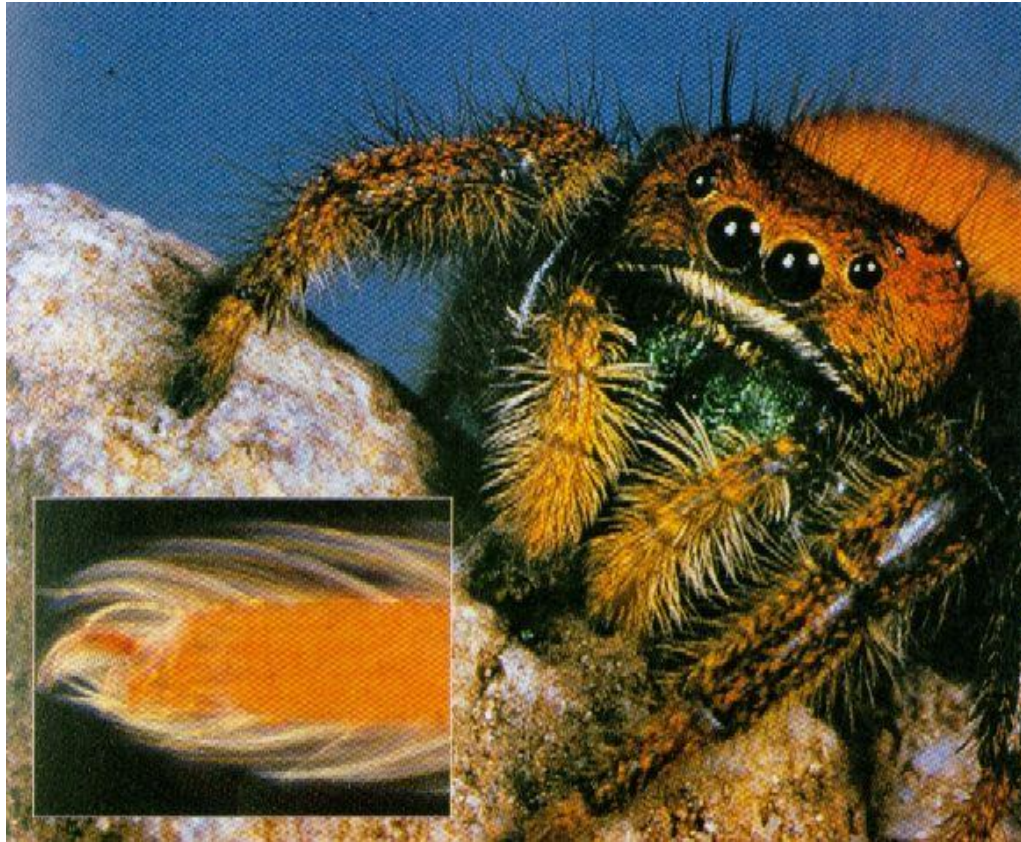
Волоски на ноге паука

Волоски на теле паука нужны для осязания.