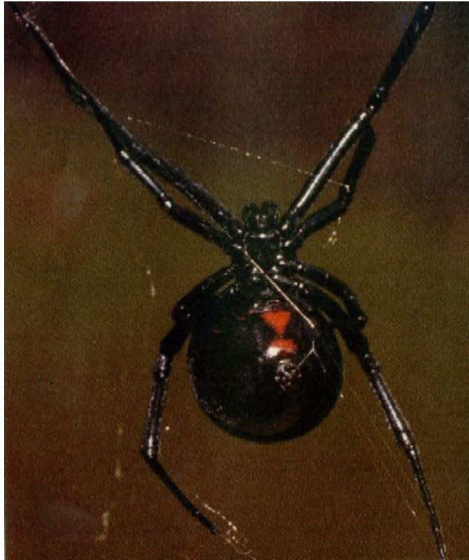
Female black widow spider

Самки пауков обычно крупнее самцов и более ядовиты.