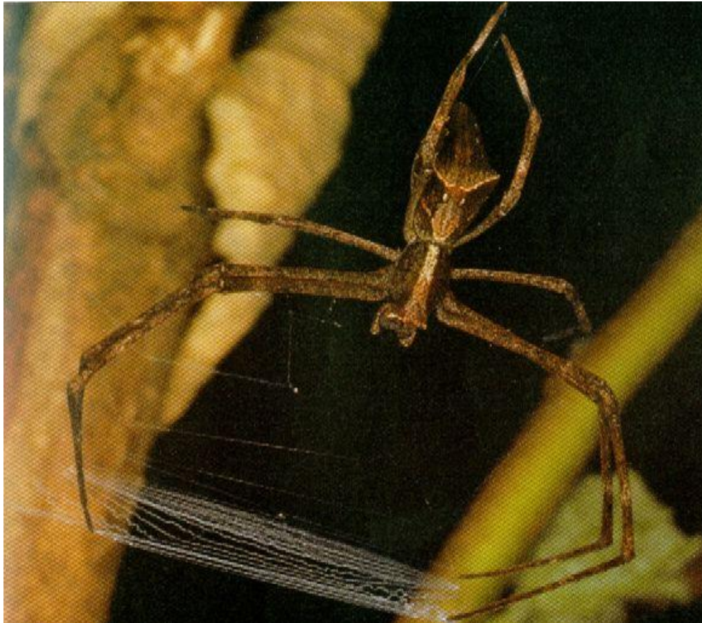
Паук, плетущий сеть.

Пауки сами выделяют вещество, из которого образуется паутина. Все пауки способны на это.