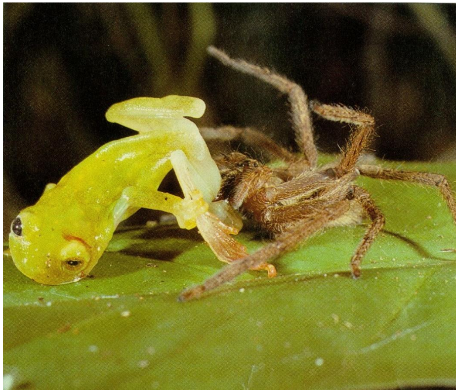
Паук, питающийся лягушками

Есть и большие пауки, которые едят птиц, мышей и лягушек.