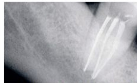
Рис. 9. Рентгеновский снимок 47-го зуба через 6 месяцев после ФАД.