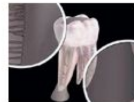
Рис. 3. Отсутствие микрофлоры после фотоактивируемой дезинфекции.