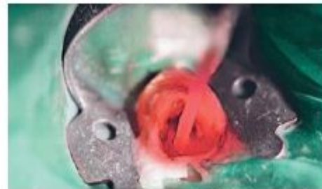
Рис. 8. ФАД с использованием световода для эндодонтического лечения.