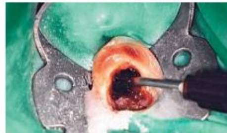
Рис. 7. Внутриканальное введение фотосенсибилизатора.