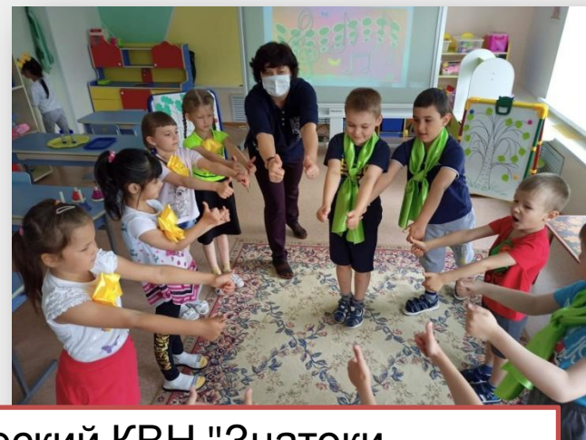
Экологический КВН "Знатоки природы"