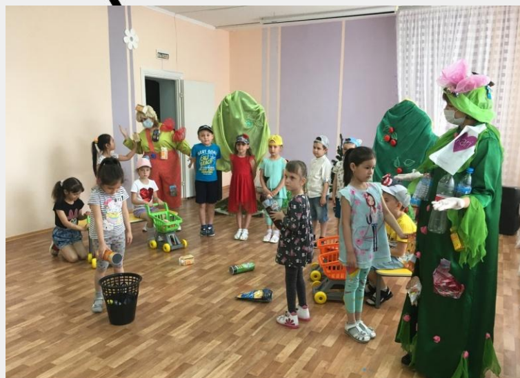
Окружной экологический фестиваль «Эколята Югры – друзья и защитники уникальной природы Севера»