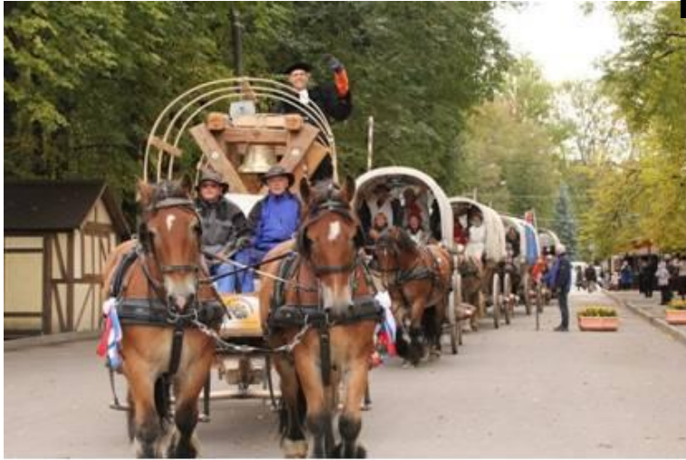
Экспедиция «Титаны пути» - из Брюка (Германия) в Новгород «Колокол Мира»