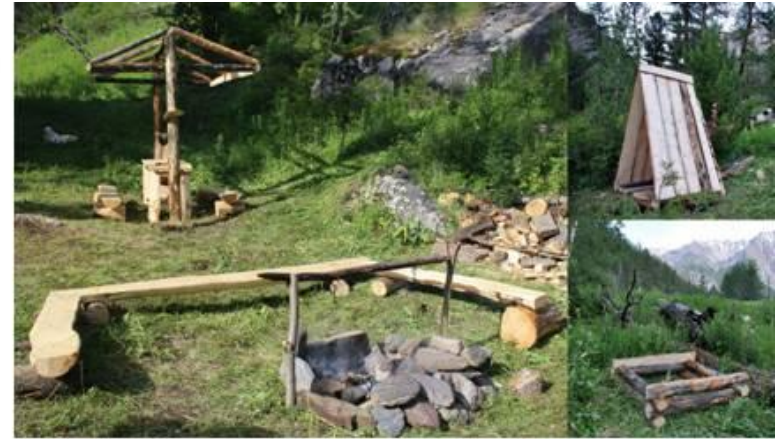
Конные тропы национальных парков и заповедников