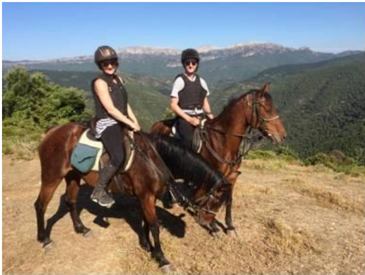
Экскурсии по заповедникам