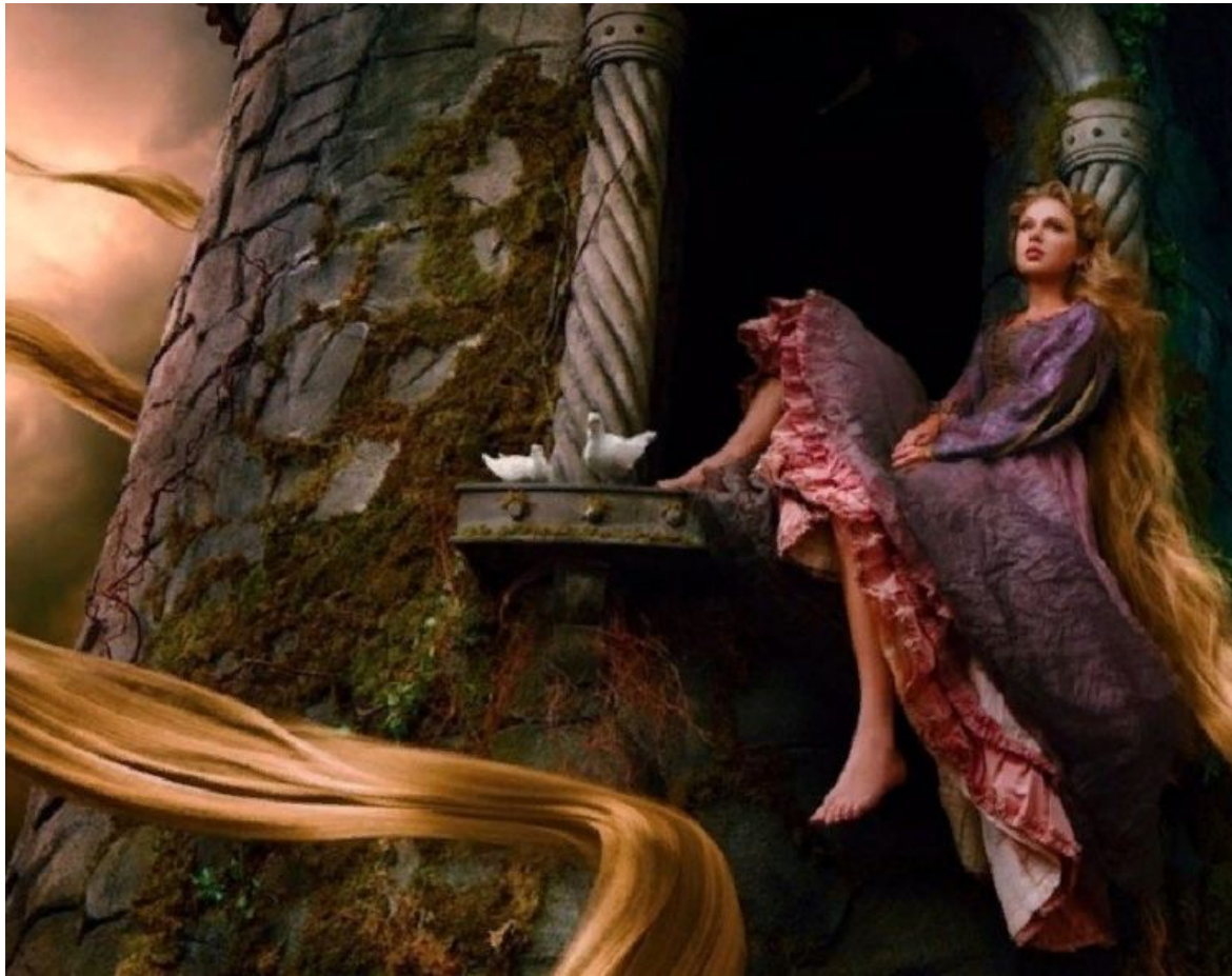
1. Тейлор Свифт в роли Рапунцель