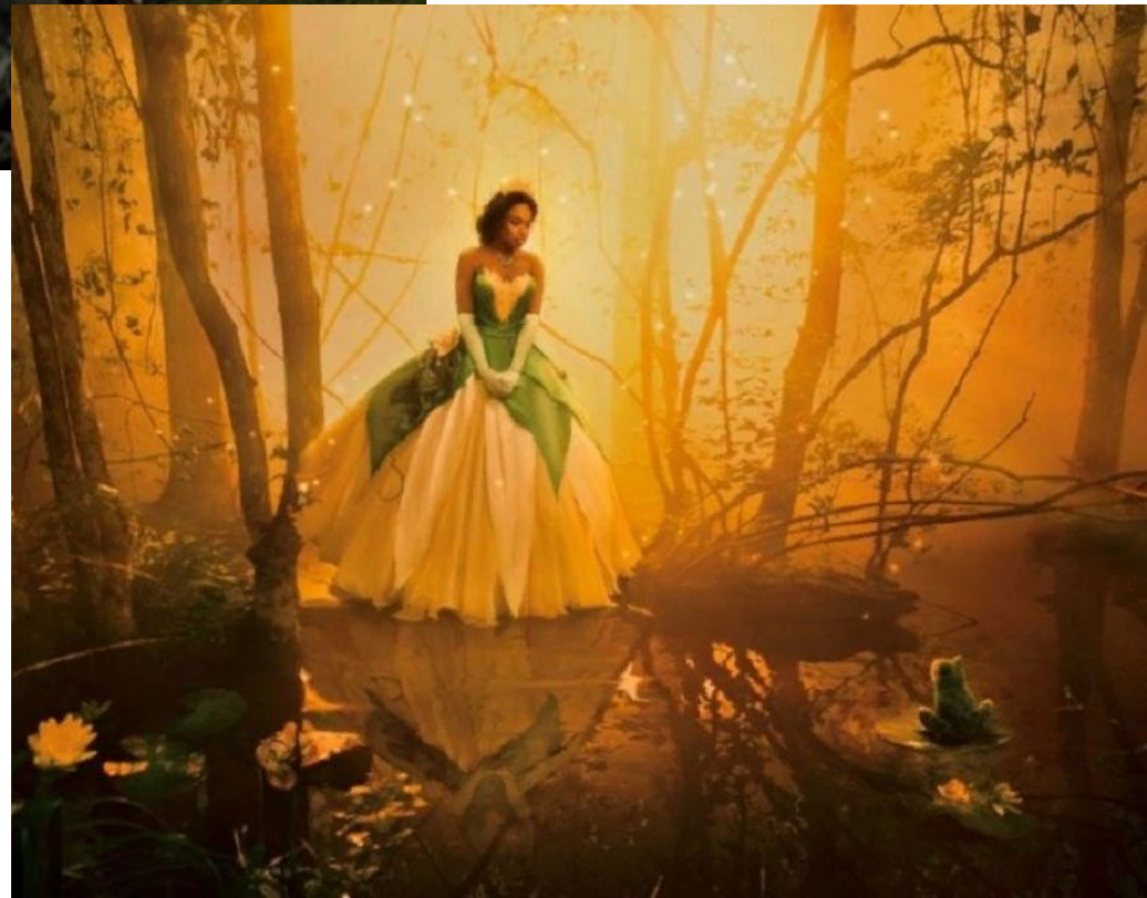
Дженнифер Хадсон в роли Тианы («Принцесса и лягушка»)