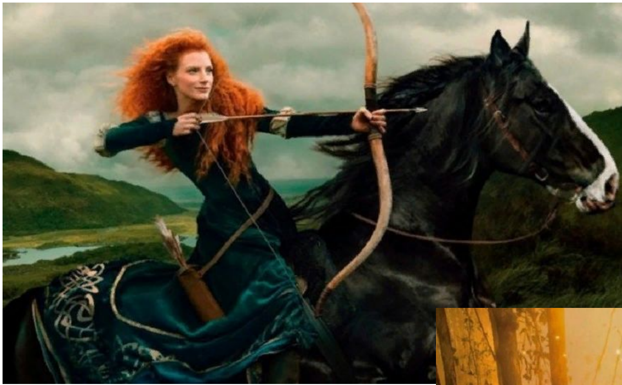
Джессика Честейн в роли Мерида («Храбрая сердцем»)