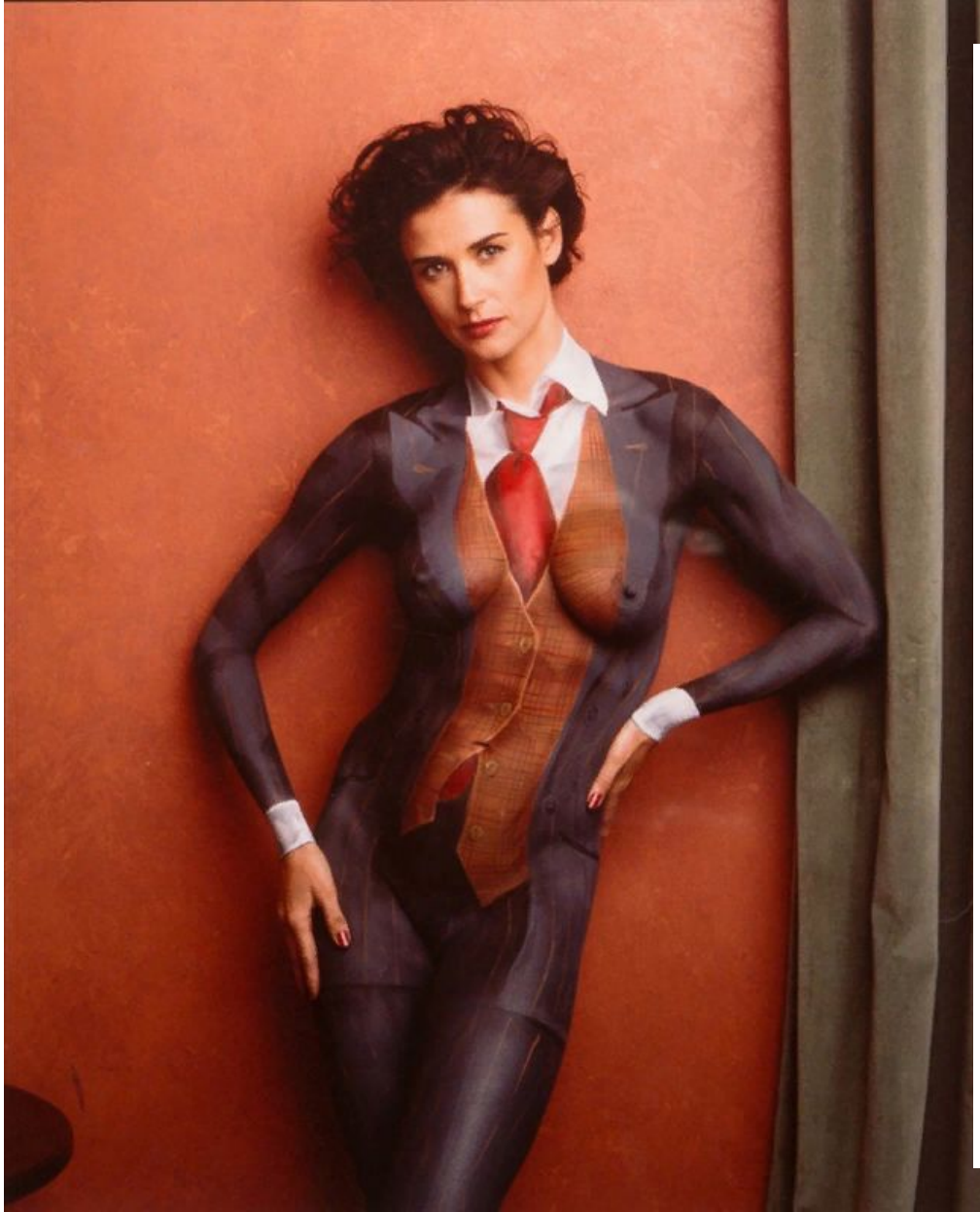
обнажённая Деми Мур в костюме, нарисованном прямо на теле.