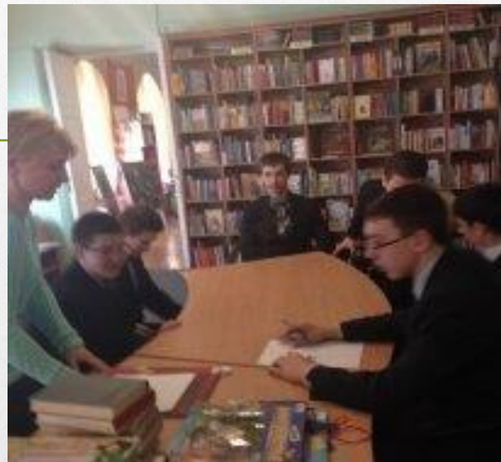
Библиотека им. А.С.Пушкина