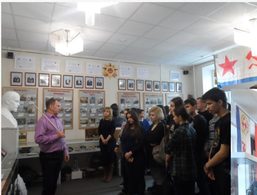
Музей водолазного дела