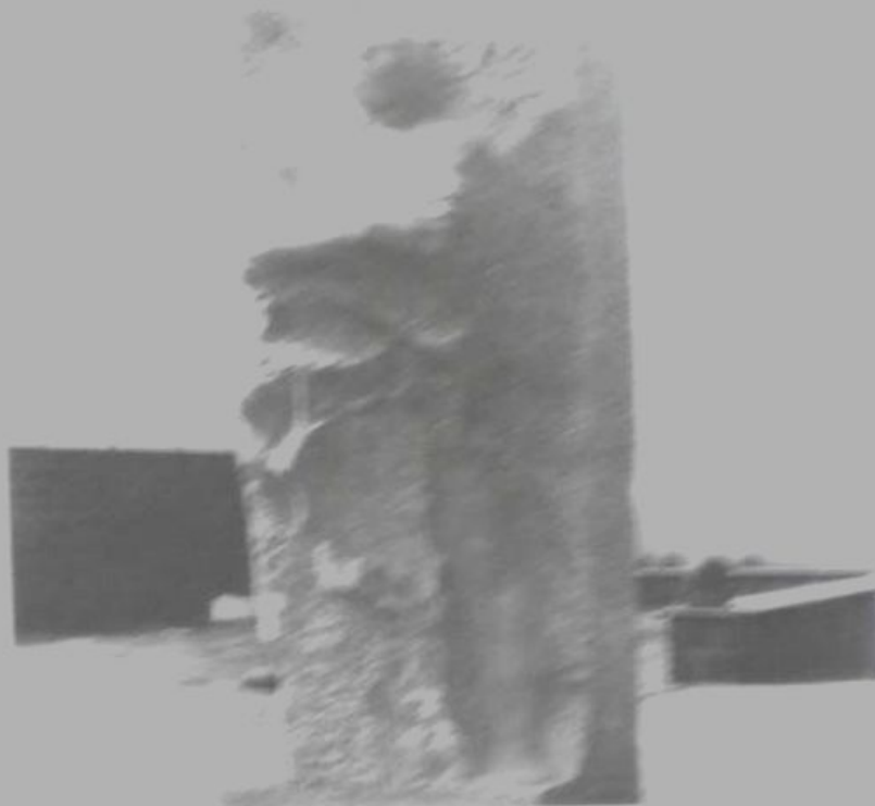
ПАМЯТНИК Д.М. КАРБЫШЕВУ В МАУТХАУЗЕНЕ (АВСТРАЛИЯ) СКУЛЬПТОР В.Е. ЦИГАЛЯ