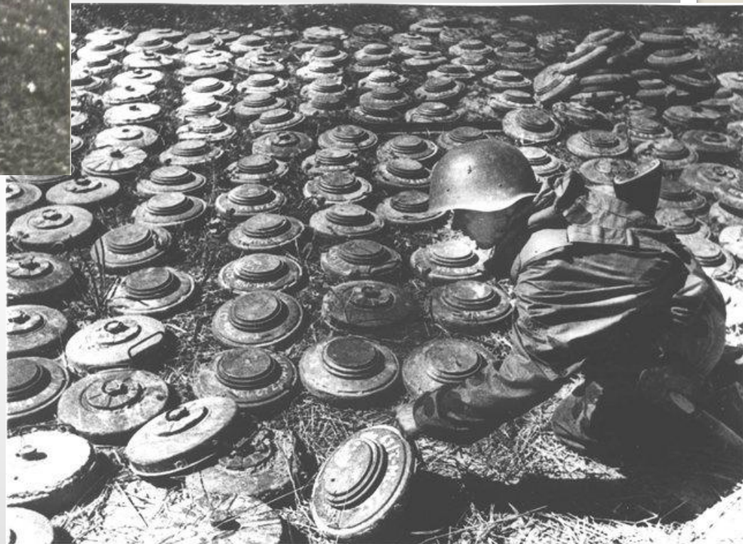
фотографии саперов 309-й Пирятинской стрелковой дивизии