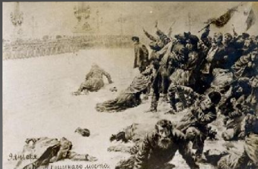
9 января. У Троицкого моста. Неизвестный художник