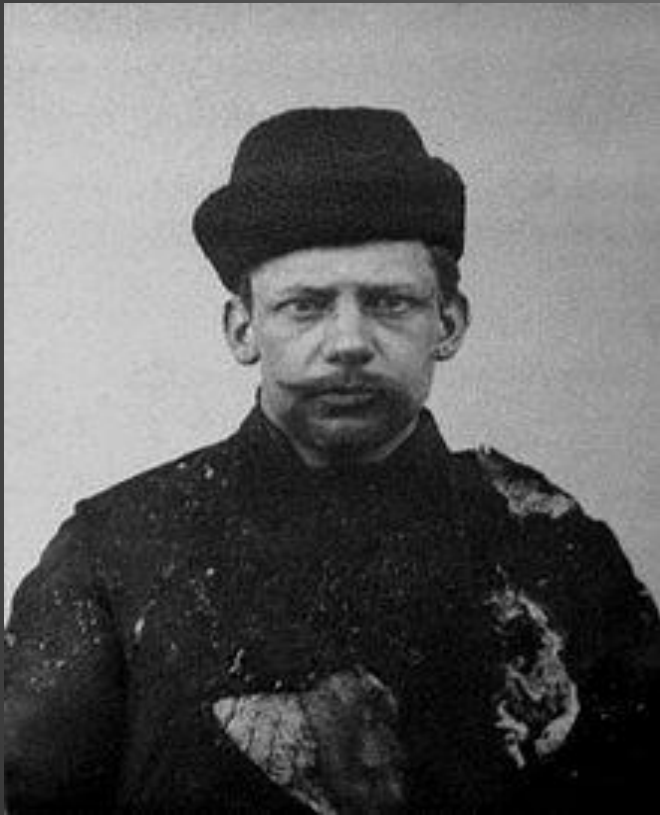
И. П. Каляев