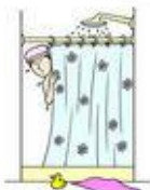
Have a shower