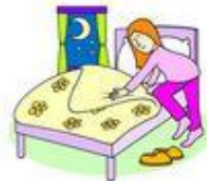
Go to bed