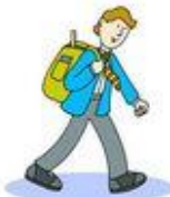
Go to school