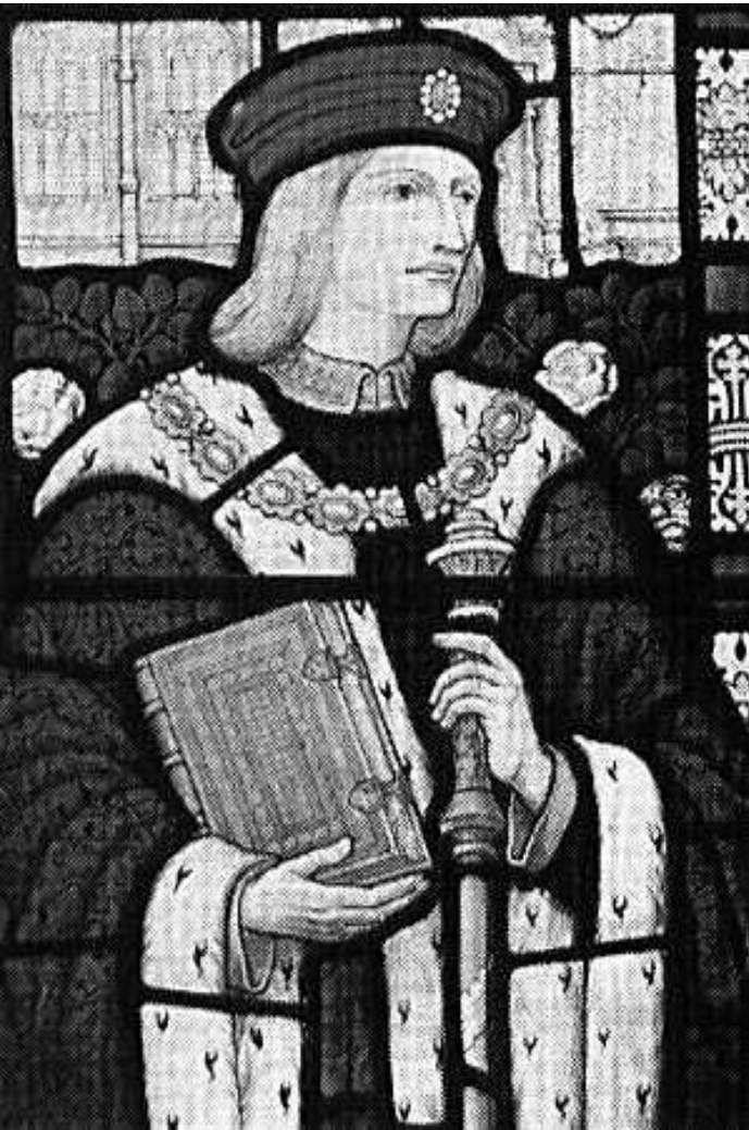
ПОРТРЕТ ХЬЮ КЛОПТОНА. МЭРА ЛОНДОНА. XV ВЕК.