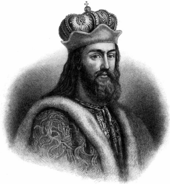
Князь Владимир Святославович 958 - 1015