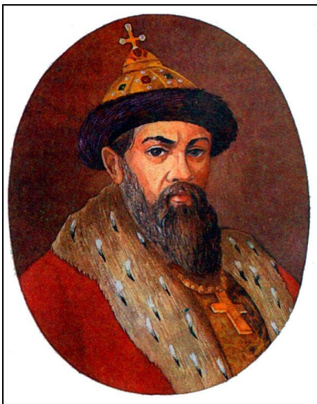
Князь Владимир Мономах

□ Владимирское Великое Княжество (1157 - 1362 гг.) образовалось в связи с переносом великим князем Андреем Боголюбским столицы Ростово-Суздальского княжества в г.Владимир на Клязьме. Существует несколько точек зрения на дату основания города. По одной версии он основан князем Владимиром Святославичем в 990 году, по другой - в 1108 году князем Владимиром Мономахом. При князе Андрее Боголюбском и его преемниках город достиг расцвета.