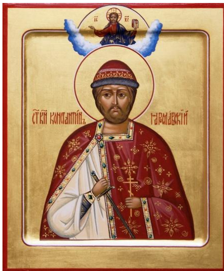
Святой благоверный князь Константин Всеволодович Ярославский