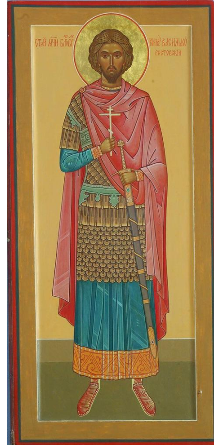
Святой благоверный князь Василько Константинович Ростовский