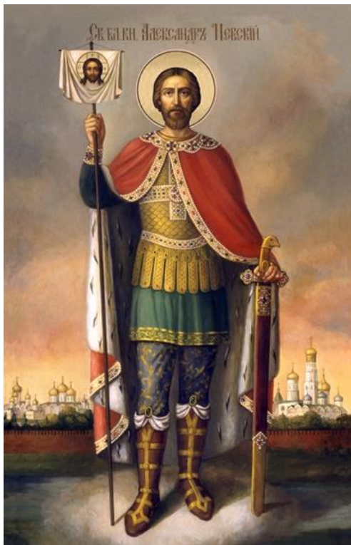
Святой благоверный князь Александр Ярославович Невский