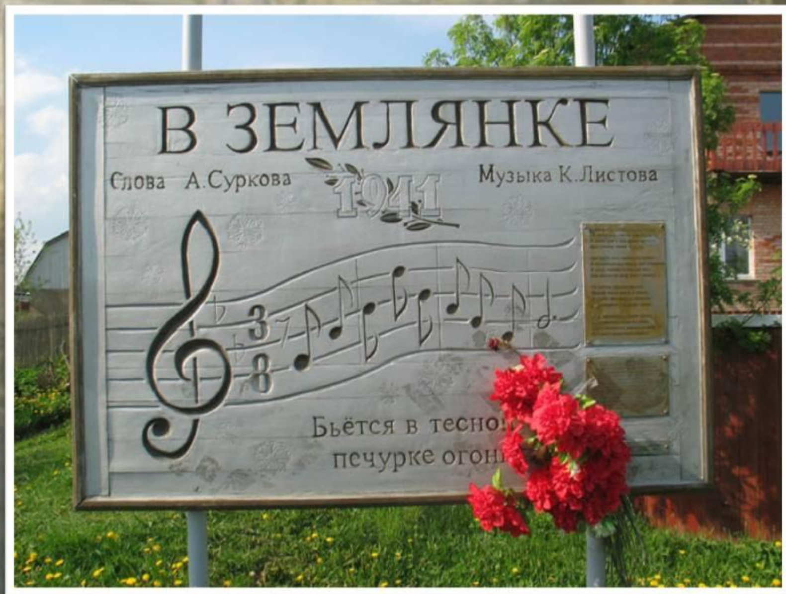
Место рождения песни. Деревня Кашино.