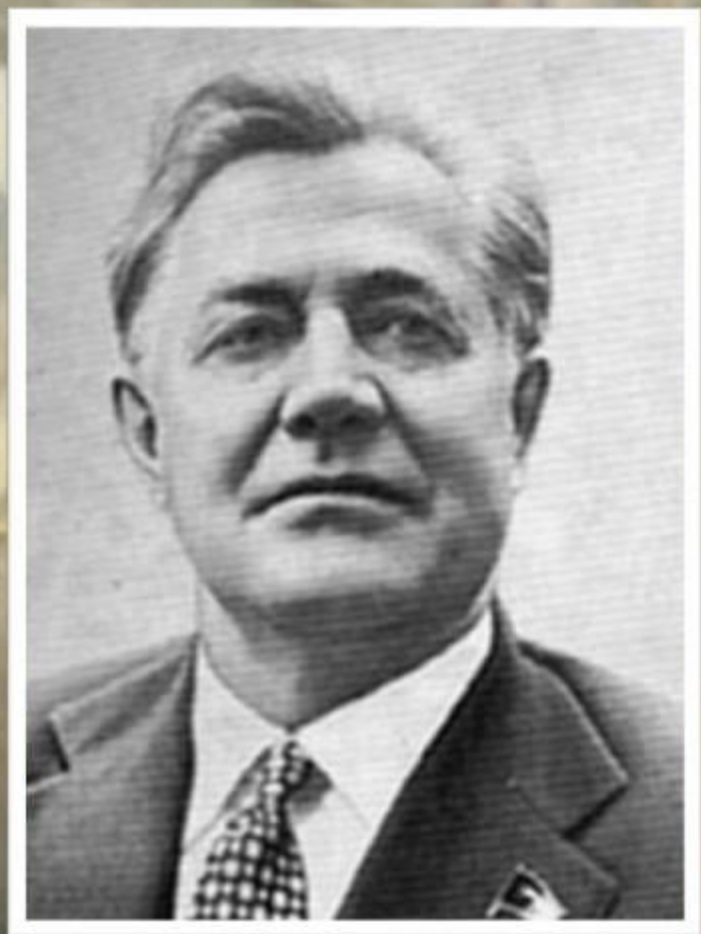
Алексей Александрович Сурков