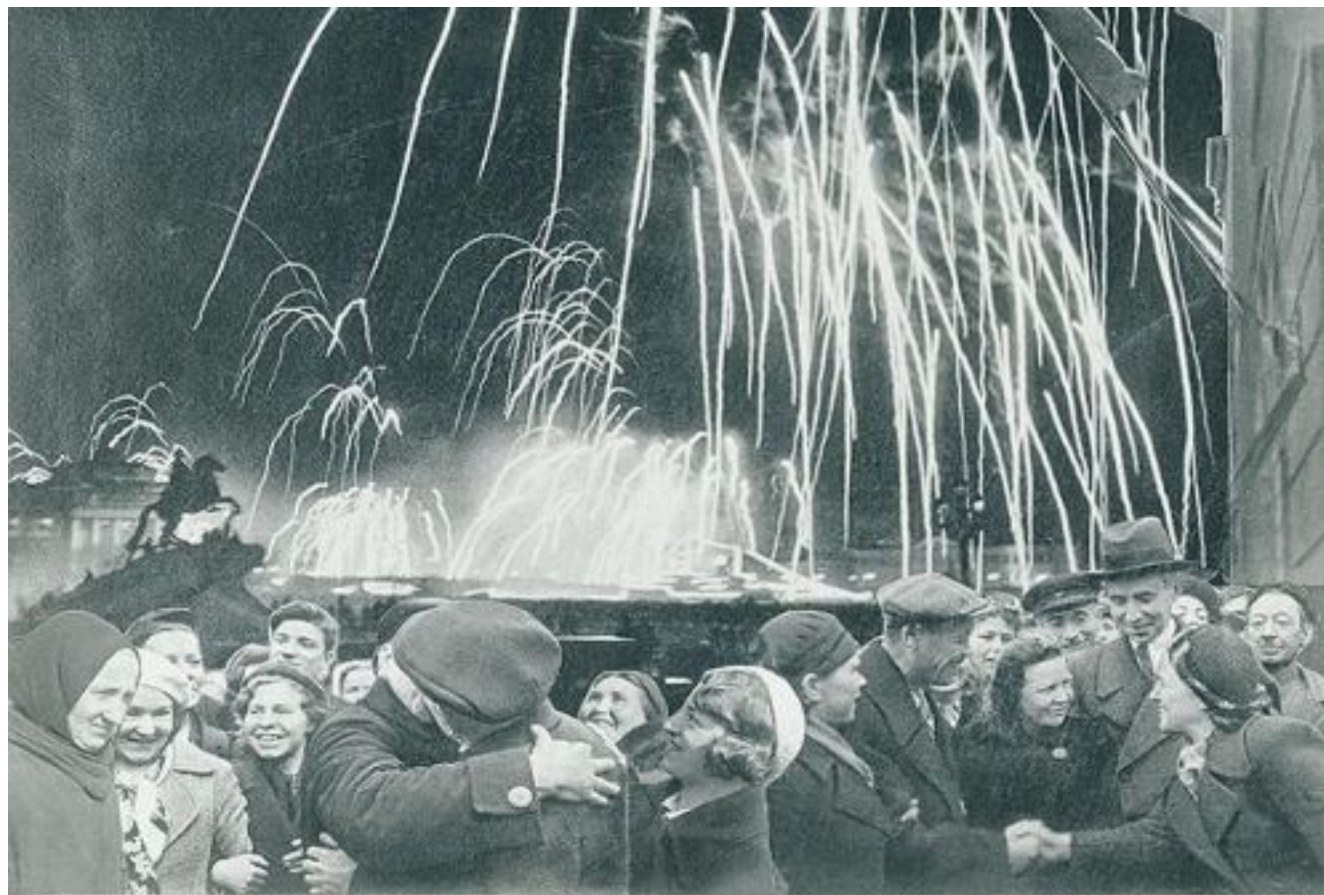
«ВЕЛИКАЯ ПОБЕДА ОДЕРЖАНА СОВЕТСКИМИ ВОЙСКАМИ ПОД ЛЕНИНГРАДОМ!»