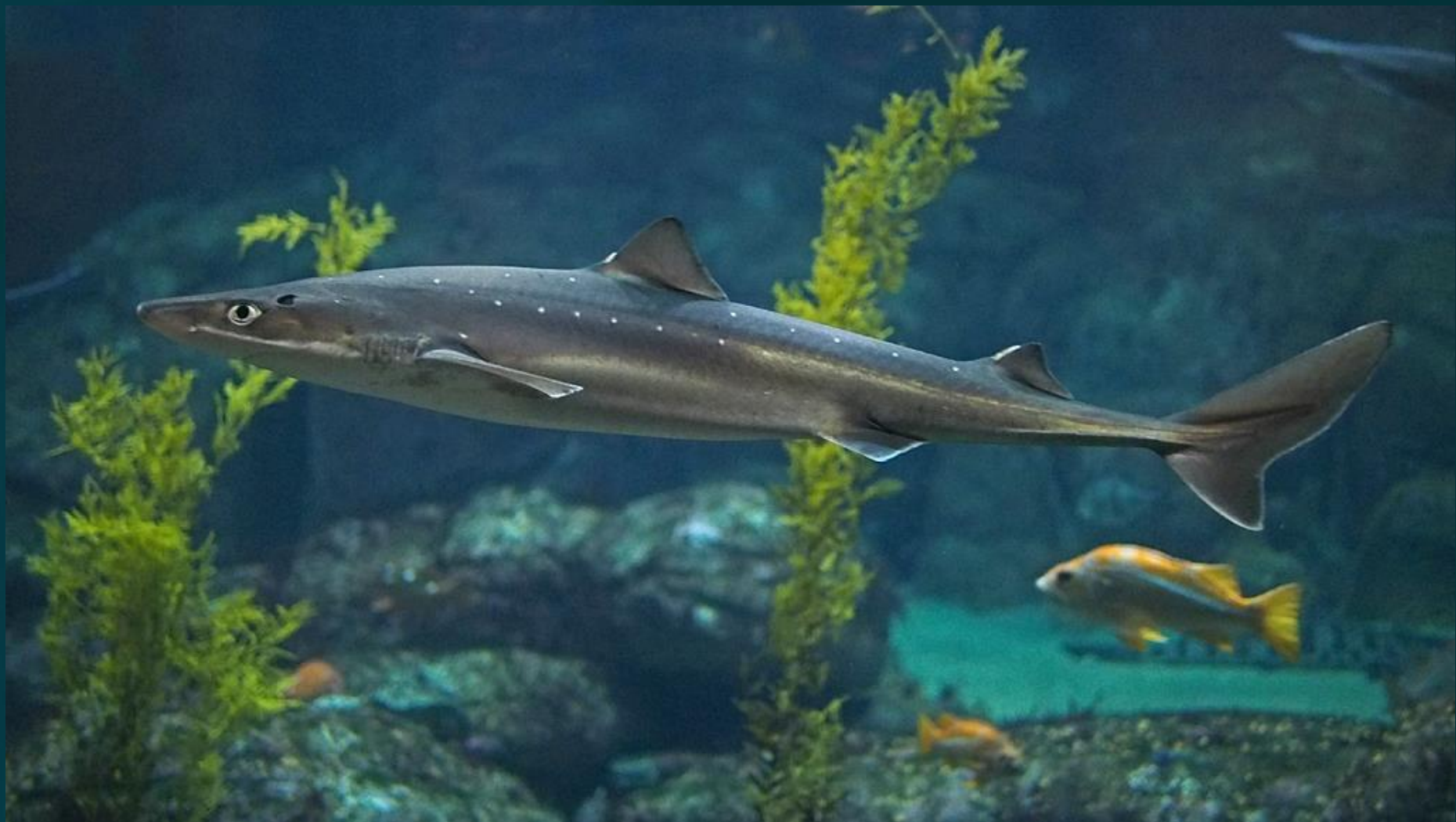
Колючая акула (катран)