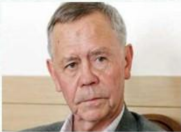
Валентин Григорьевич Распутин (15 марта 1937 – 14 марта 2015) — русский сибирский писатель, представитель «деревенской прозы».