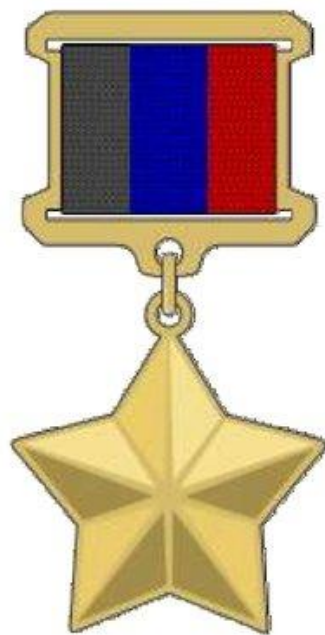
Звезда Героя РФ