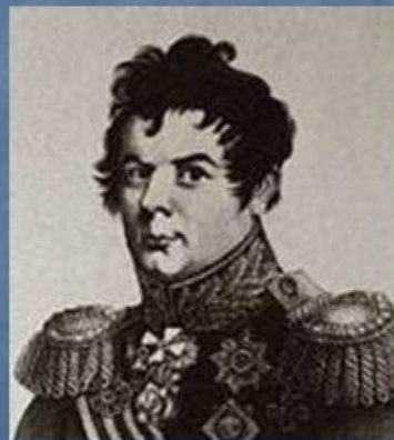
И. И. Дибич-Забалканский