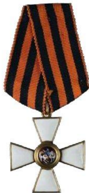
Орден Святого Георгия