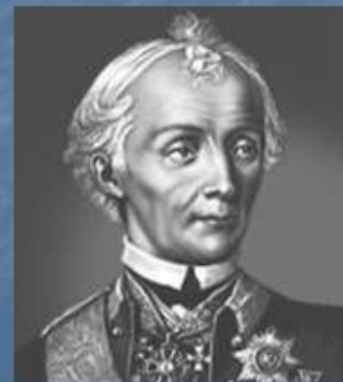
А. В. Суворов