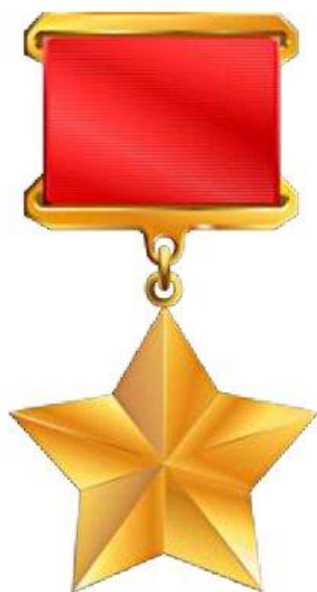
Звезда Героя Советского Союза

В этот день чествуют Героев Советского Союза, Героев Российской Федерации, полных кавалеров ордена Славы и кавалеров ордена Святого Георгия.