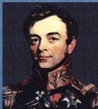
И. Ф. Паскевич