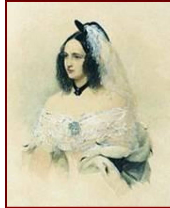
Н.Н. Пушкина, 1843 Художник В.И. Гау

На холмах Грузии лежит ночная мгла; Шумит Арагва предо мною. Мне грустно и легко; печаль моя светла; Печаль моя полна тобою, Тобой, одной тобой... Унынья моего Ничто не мучит, не тревожит, И сердце вновь горит и любит — оттого, Что не любить оно не может.