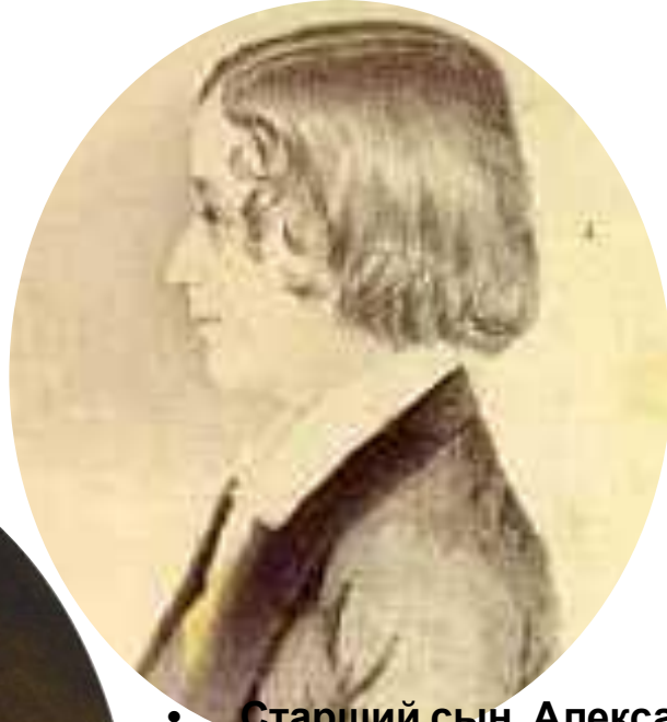
• Старший сын, Александр Александрович Пушкин