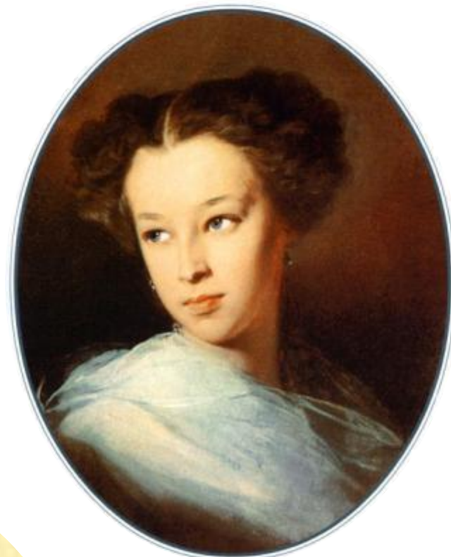
Младшая дочь, Наталья Александровна Пушкина