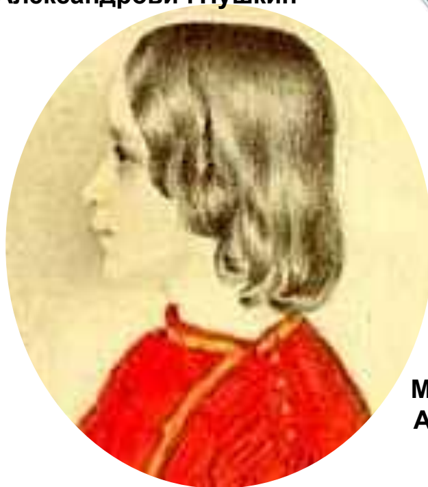
Младший сын, Григорий Александрович Пушкин