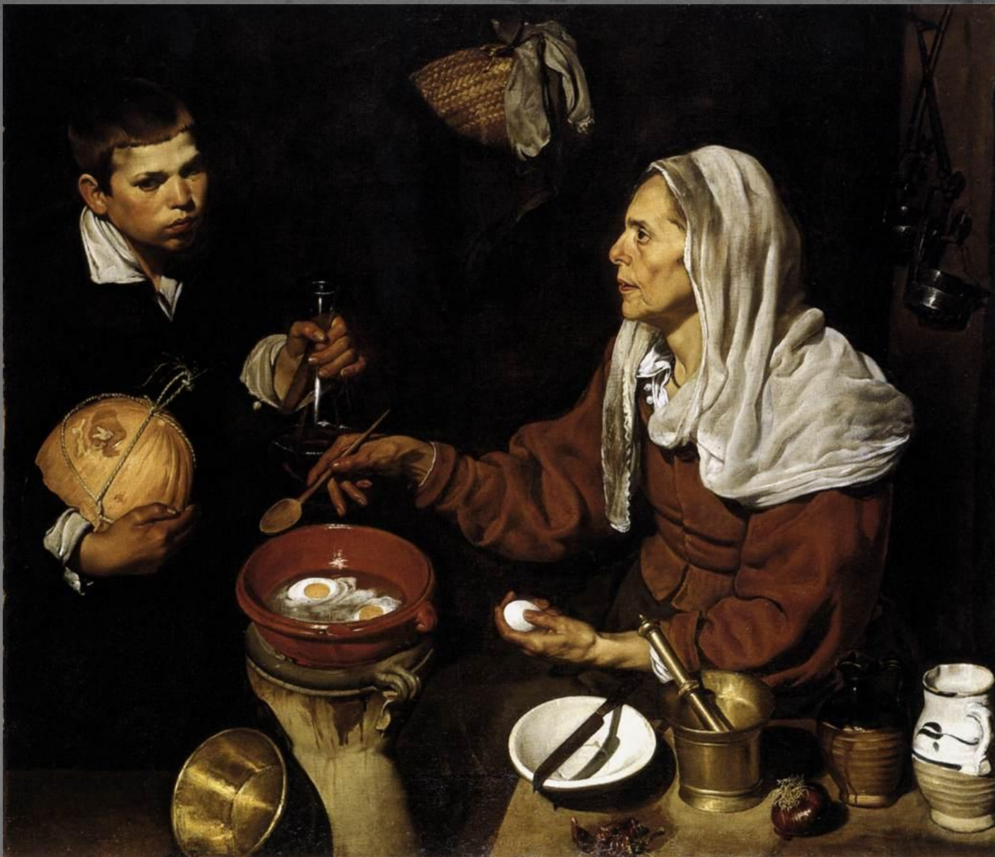
Старая кухарка. 1618.