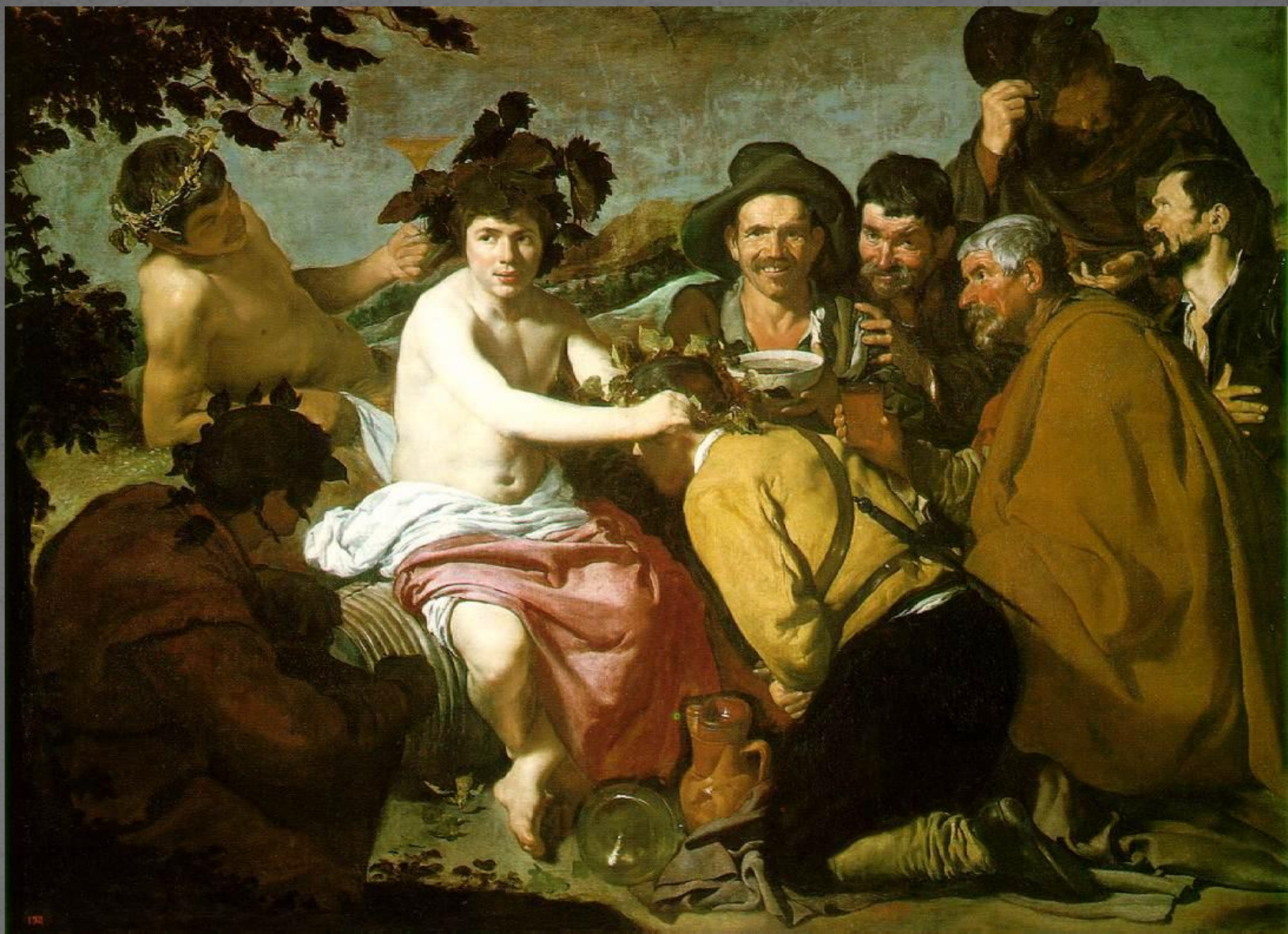
Триумф Вакха или пьяницы.1628.Прадо. Мадрид.