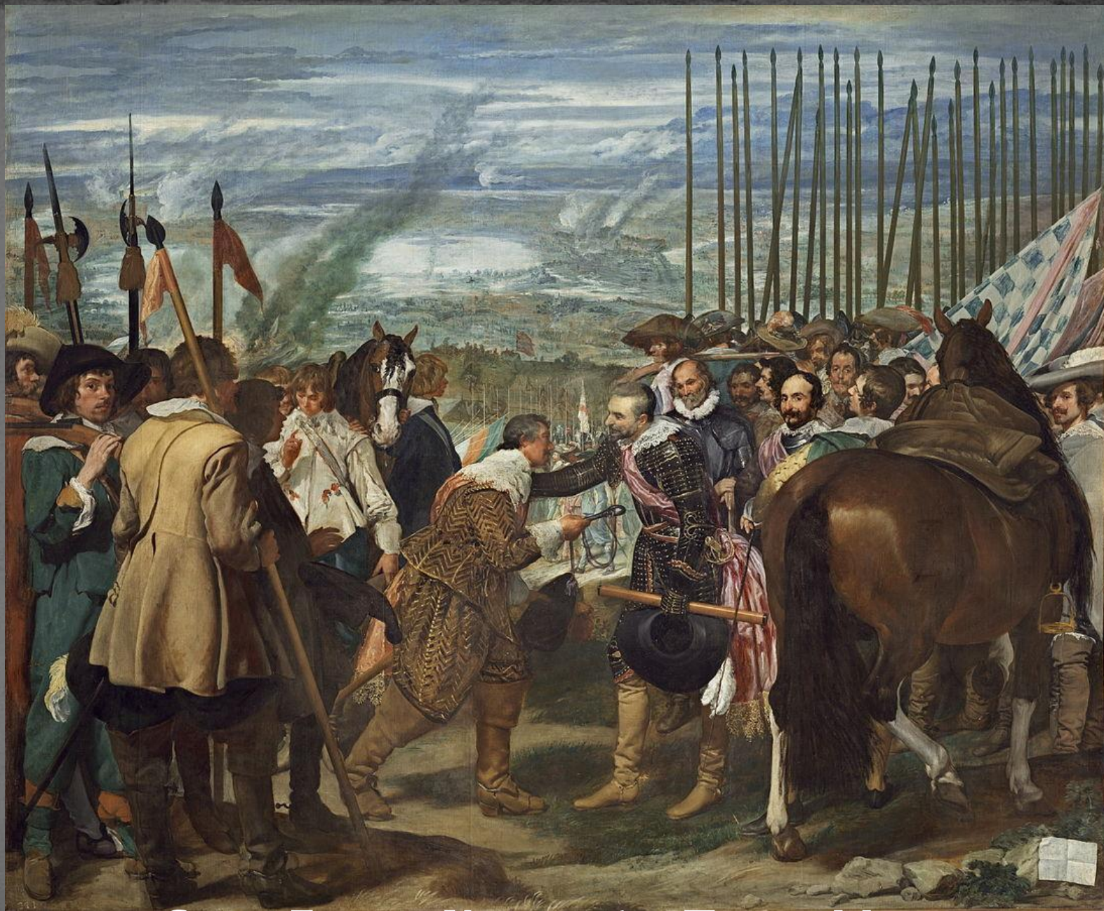
Сдача Бреды. Копья. 1634. Прадо. Мадрид.