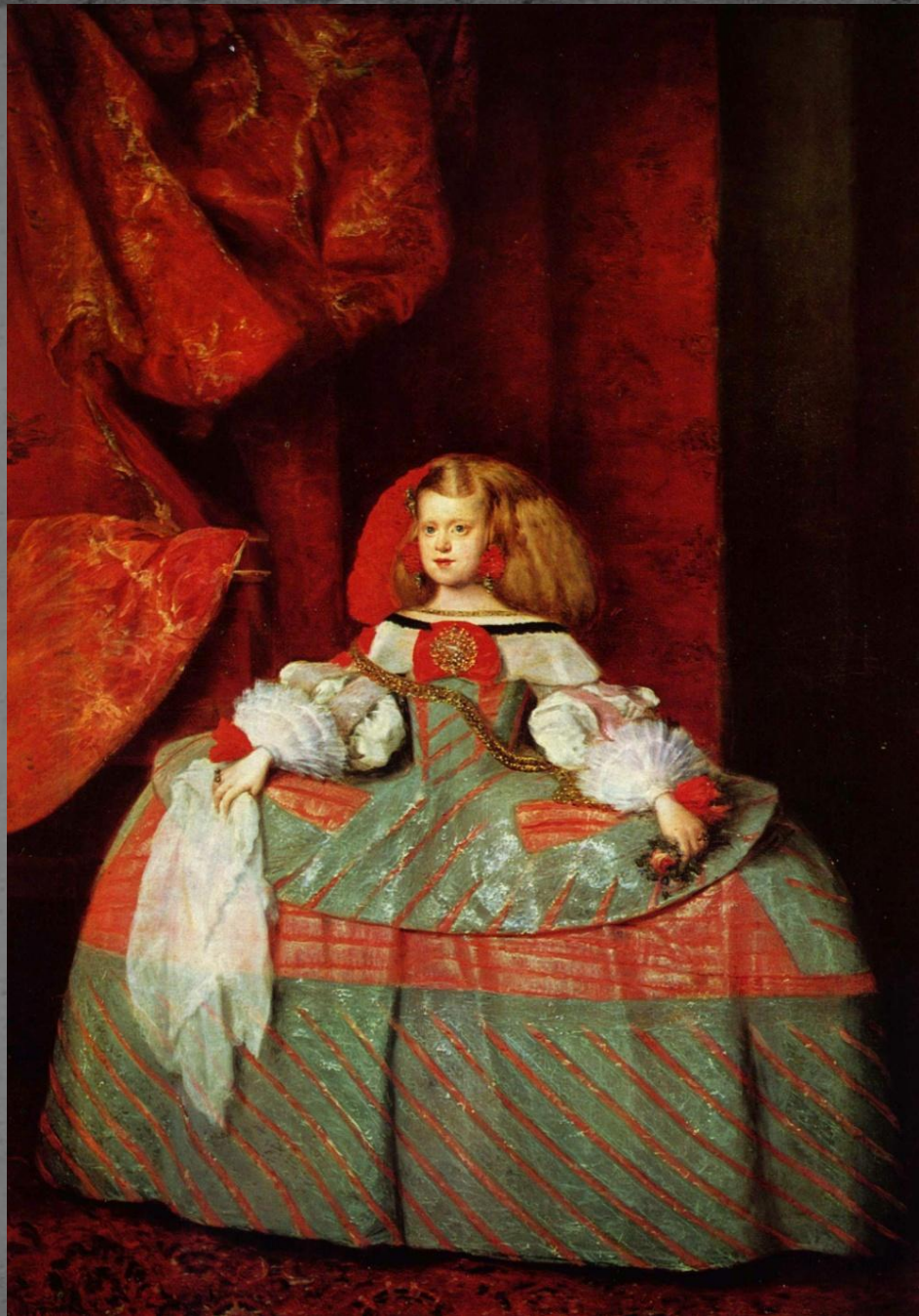
Портрет инфанты Маргариты.