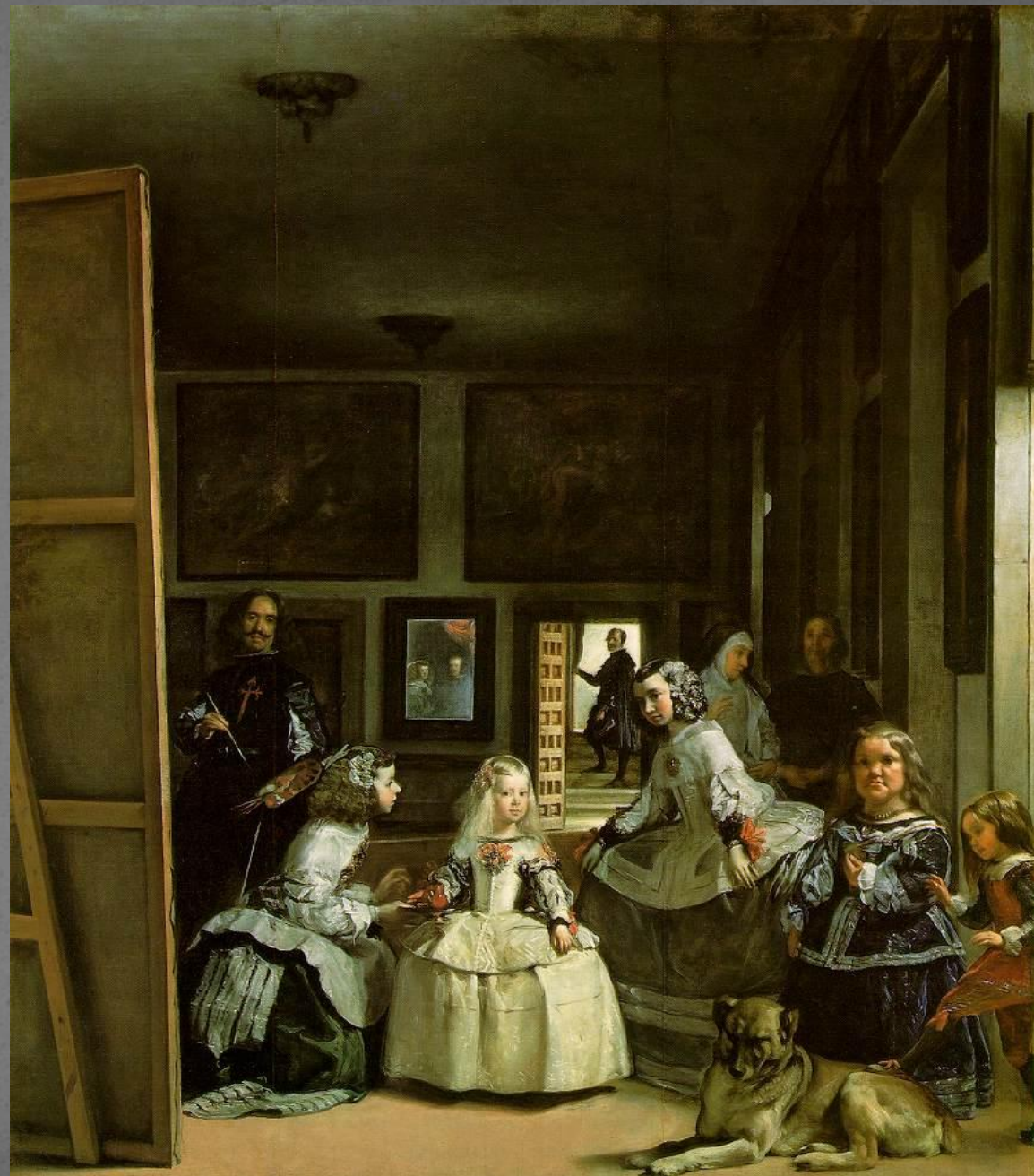
Менины. (фрейлины) 1657. Прадо. Мадрид.