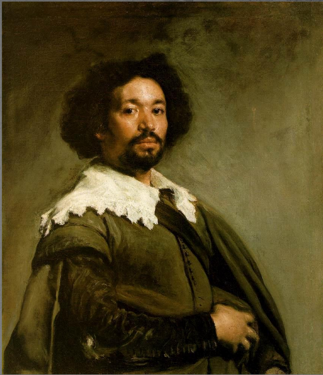
Портрет Хуана де Пареха.1650.