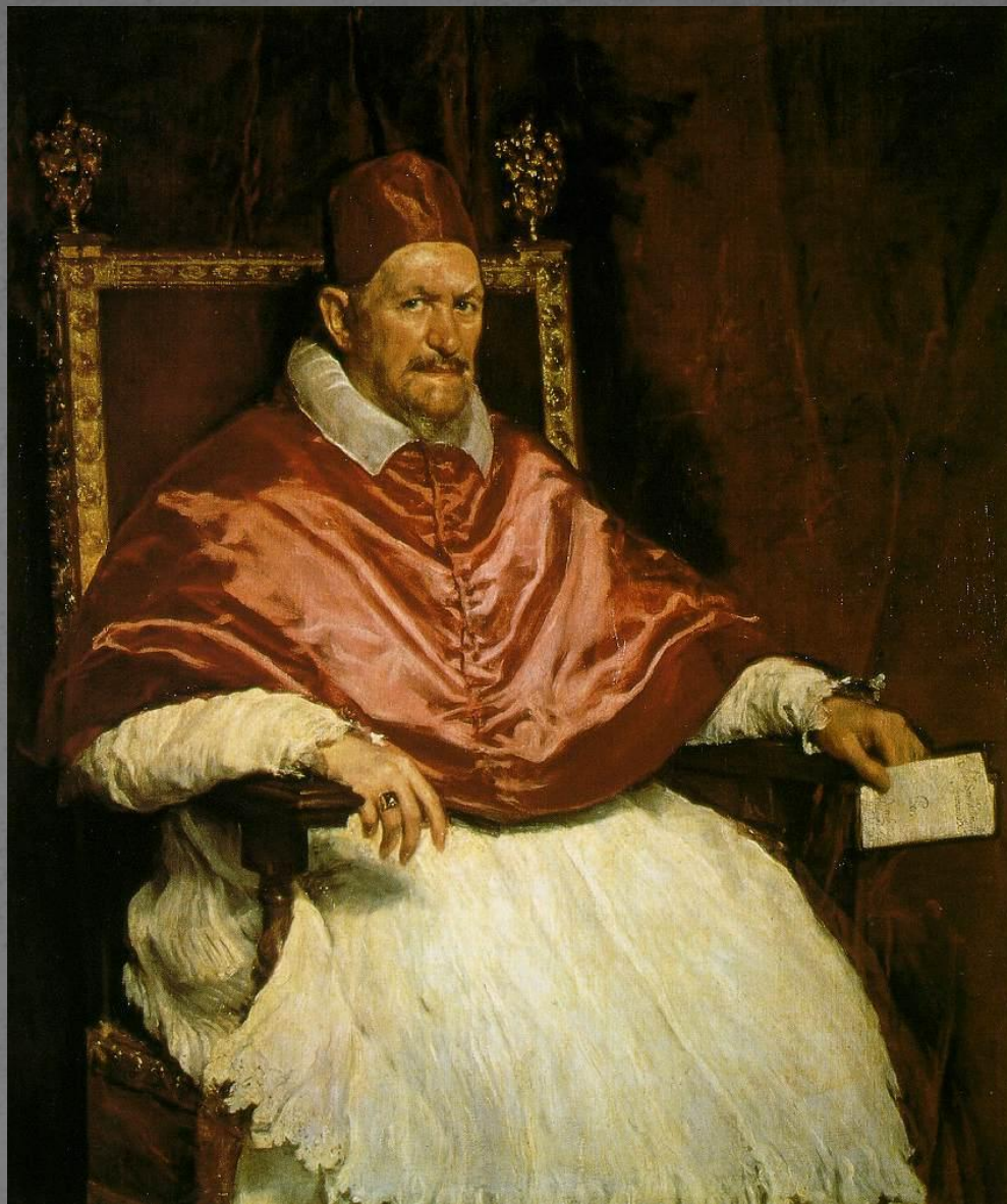
Портрет папы Иннокентия X.1650. Рим.