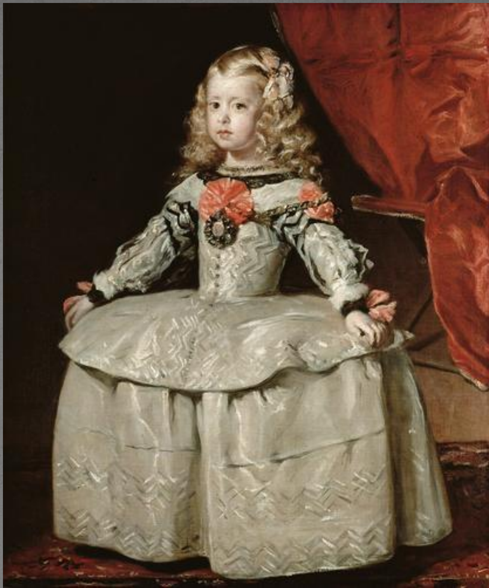
Портрет инфанты Маргариты.