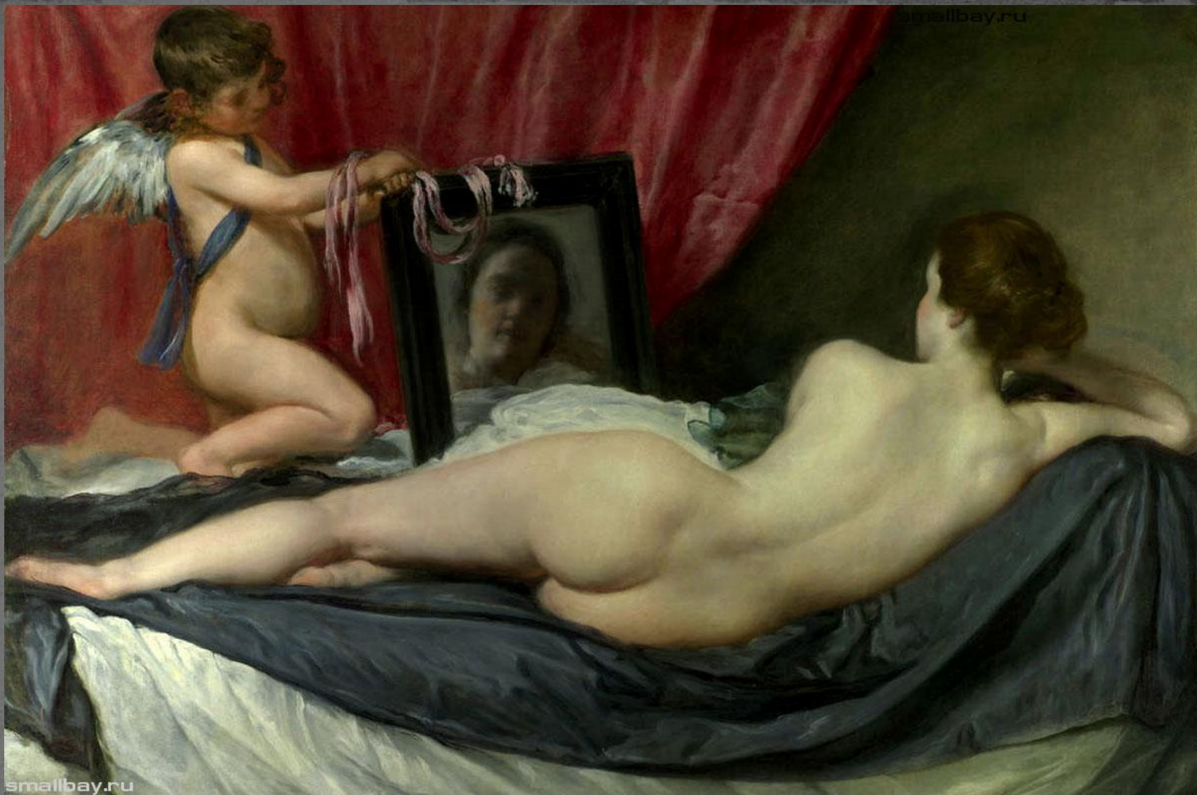
Венера с зеркалом. Ок.1644-1648. Национальная галерея. Лондон.