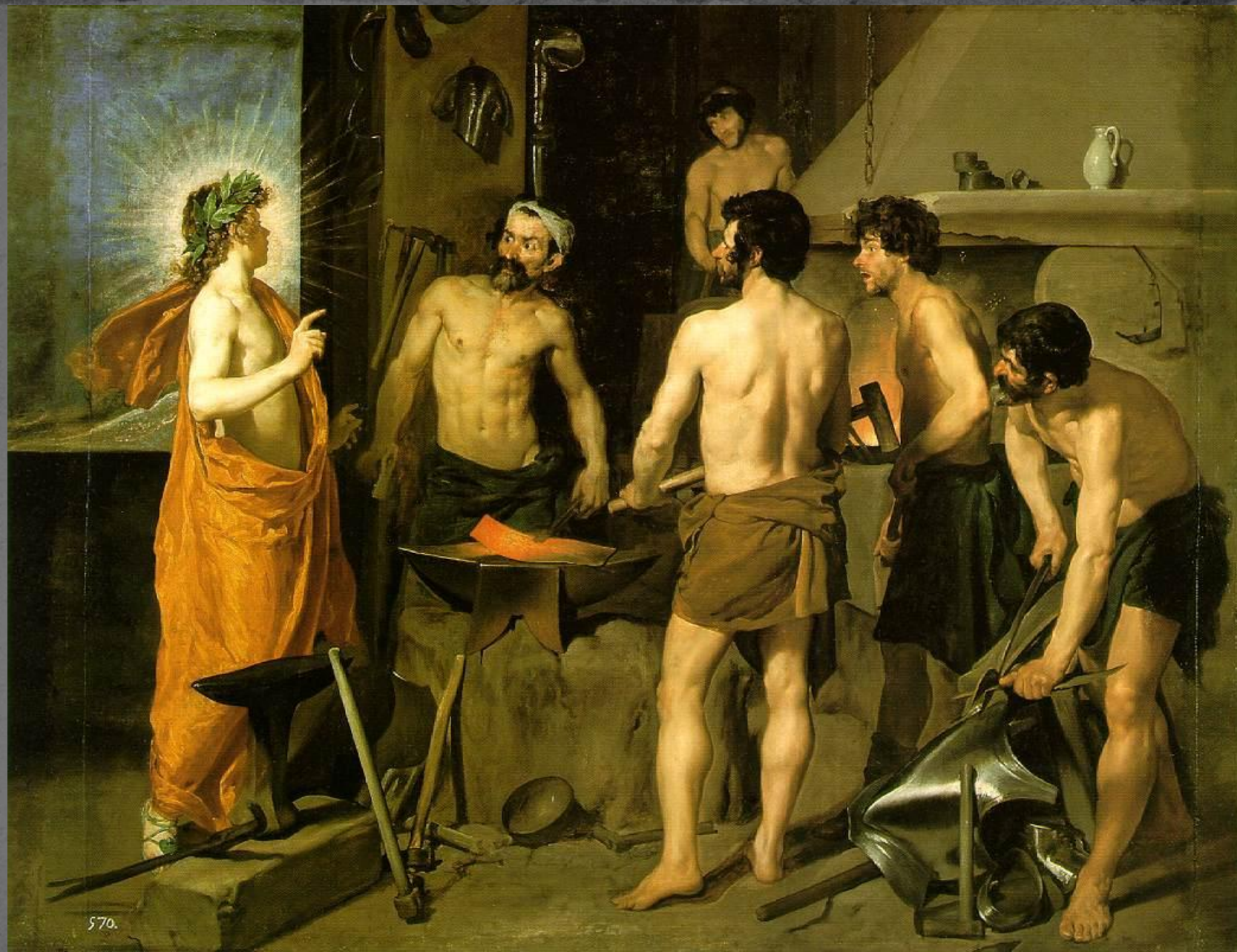
Кузница Вулкана. 1630. Прадо. Мадрид.