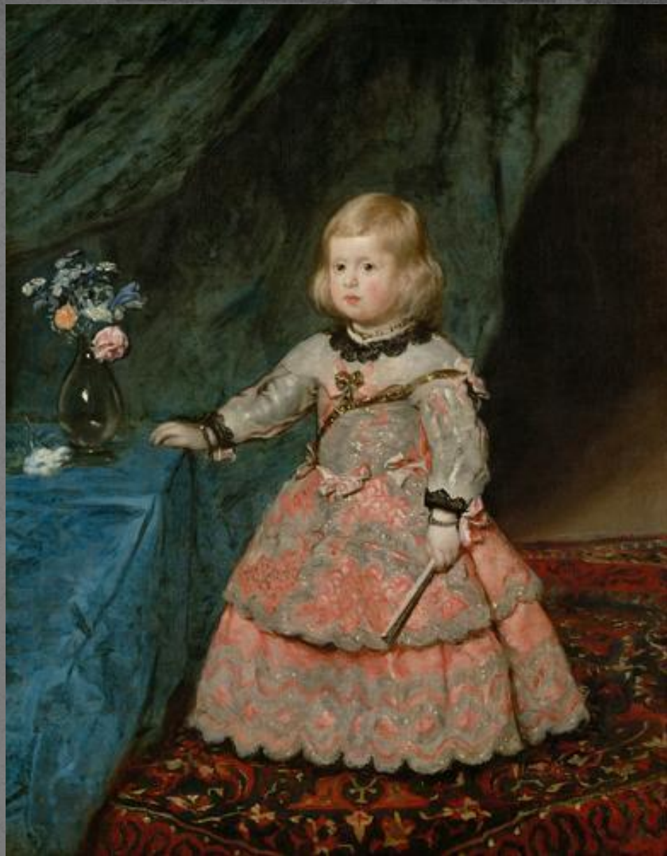
Портрет инфанты Маргариты.