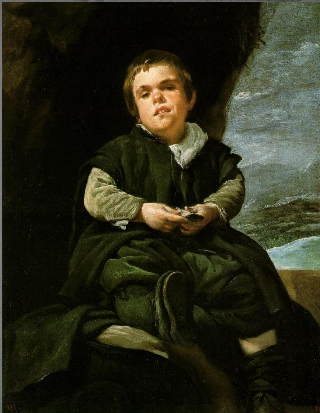
Портрет Франсисо Лескано.