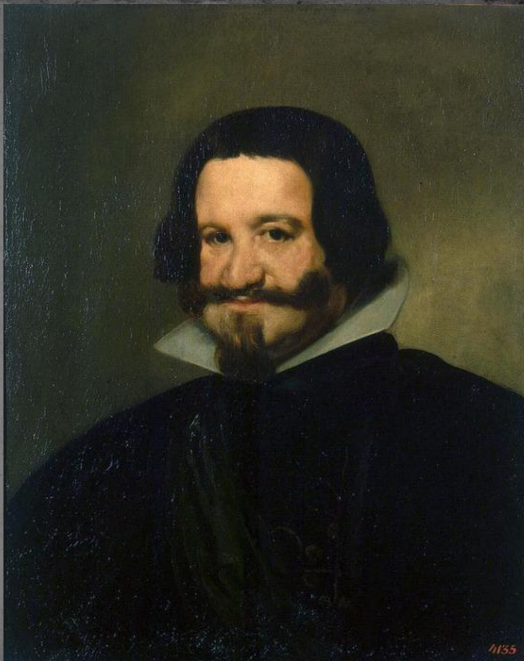
Портрет графа Оливареса. Ок.1638. Эрмитаж.