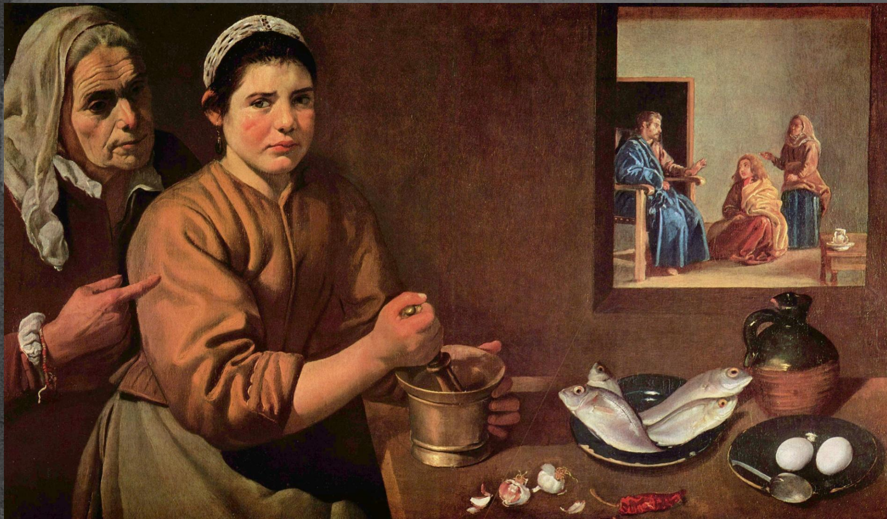
Христос в доме Марии и Марфы. 1620.